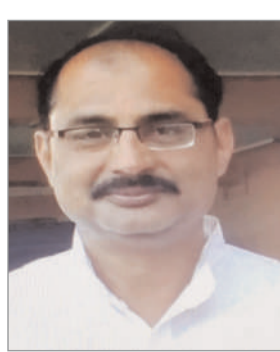
के दुष्परिणामों के बारे में जागरूक होंगे तो इस अपराध के खिलाफ अभियान में उनकी भागीदारी और कार्यवाहियों बच्चों की सुरक्षा के लिए लोगों के नजरिए और बर्ताव में बदलाव

विवाहों पर रोक लगाने के लिए 'बेहद कड़ी नजर' रखने को कहा है। यद्यपि इस सूची में शामिल नामों में कुछ विवाह पहले ही का यह फौरी आदेश हज़रत राइट्स फॉर चिल्ड्रेन एलायंस का है। इन संगठनों ने अपनी याचिका में इस वर्ष 10 मई को अक्षय तृतीया के मौके पर होने वाले बाल विवाहों को रोकने के लिए तत्काल हस्तक्षेप की मांग की थी। याचिकाओं द्वारा बंद लिफाफे में सौंपी गई अक्षय तृतीया के दिन होने वाले 54 बाल विवाहों की सूची पर गौर करने के बाद खंडपीठ ने राज्य सरकार को इन