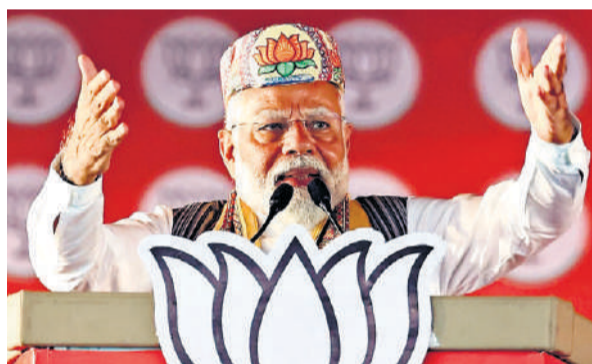
पीएम 12 और 16 मई को आएंगे झारखंड, करेंगे जनसभा पेज-08

लोकसभा चुनाव को लेकर प्रधानमंत्री नरेंद्र मोदी अपने तुफानी दौर के रविवार को उत्तर प्रदेश के इटावा पहुंचे। यहां तीसरे चरण में वोटिंग होनी है। पीएम मोदी ने समाजवादी पार्टी (सपा) के नेताओं को रैली में आड़े हाथों लिया। पीएम मोदी ने कहा कि सपा और कांग्रेस वाले अपने बच्चों के लिए, अपने बच्चों के भविष्य के लिए चुनाव लड़ रहे हैं। जबकि मोदी और योगी आपके बच्चों के लिए, आपके