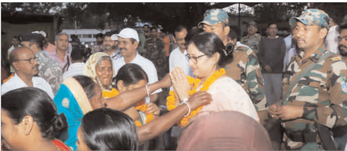
की बात कहां? अपनी तमाम साजिशें विफल होता देख चोरों की ये जमात दुष्प्रचार पर उतर आयी है। गड़ड़ी बाजार में एक जनसभा को संबोधित करते हुए अन्नपूर्णा देवी ने ये बातें कहीं। अन्नपूर्णा देवी ने कहा कि इन दिनों चोरों के टगबंधन ने लोकतंत्र और संविधान को खतरे में

संवाददाता कोडरमा : केन्द्रीय शिक्षा राज्य मंत्री एवं कोडरमा संसदीय क्षेत्र से भाजपा प्रत्याशी अन्नपूर्णा देवी ने कहा कि प्रधानमंत्री श्री नरेन्द्र मोदी के कड़े और बड़े फैसलों से देश की जनता तो खुश है लेकिन लुटेरों और ठगों की नौद हुराम हो गयी है। इनमें से कुछ जेल में हैं, कुछ बेल पर हैं और कुछ लोगों को जेल जाने का डर सता रहा है। यही वजह है कि मतलबपरस्त गठबंधन बनाकर सारे चोर इकट्ठा हो गए हैं और किसी भी कीमत पर मोदी जी को प्रधान सेवक की भूमिका से बेदखल करना चाहते हैं। लेकिन जिन्होंने देश के कण-कण और जन-जन से सीधा रिश्ता बना लिया हो उन्हें लोकतांत्रिक तरीके से अपदस्थ करना इनके बस