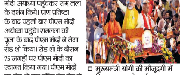
मुख्यमंत्री योगी की मौजूदगी में किए रामलला के दर्शन

अयोध्या। रविवार को पीएम मोदी अयोध्या पहुंचकर राम लला के दर्शन किये। प्राण प्रतिष्ठा के बाद पहली बार पीएम मोदी अयोध्या पहुंचे। रामलला की पूजा के बाद पीएम मोदी ने मेगा रोड शो किया। रोड शो के दौरान 75 जगहों पर पीएम मोदी का स्वागत किया गया। पीएम मोदी का रोड शो राम मंदिर मेन गेट से राम पथ होते हुए लता मंगेशकर चौक तक पहुंचा। रोड शो के दौरान 75 जगहों पर पीएम मोदी का स्वागत किया गया। रथ पर प्रधानमंत्री के साथ सीएम योगी भी मौजूद थे। रोड शो के दौरान लोगों ने पीएम मोदी का भव्य स्वागत किया। जगह-जगह पर उनके ऊपर फूलों की बरसात की गई। शेष पेज 08 पर