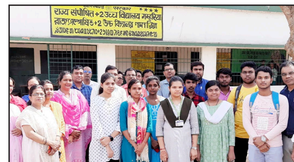
शुक्रवार को विद्यालय में टॉप टेन बच्चों का स्वागत करते प्रधानाचार्य