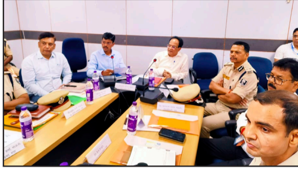
आजमीने हज जेद्दाह के से 70 वर्ष आयुवर्ग के हैं। लिए रवाना होंगे। जिसमें गया अंतरराष्ट्रीय हवाई अड्डा लगभग सभी औसतम 60 पर पर्याप्त रजाकार रहेगे

(न्यूज12 भारत) प्रक्षेत्र, जिला पदाधिकारी गया, वरीय पुलिस अधीक्षक, जिला स्तरीय विभिन्न वरीय पदाधिकारी गण, हज कमेटी गया के सम्मानित सदस्य गण के साथ समीक्षा बैठक का आयोजन किया गया है। इस बैठक में बताया गया कि हज यात्रा शुरुआत दिनांक 26 मई से 01 जून 2024 तक संभावित है, जिसमें गया अंतरराष्ट्रीय हवाईअड्डा से जिले के लगभग 1083