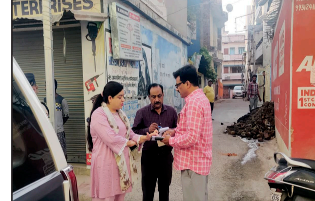
बॉटम नाला में निरीक्षण के दौरान निर्देश दिया गया की अधिक मजदूर लगाकर सफाई कार्य जल्द सफाई कराएं एवं जिस नाला में जहां पर मशीन से सफाई हो सकता है वहां मशीन से सफाई कराना सुनिश्चित करें। डिसिल्टिंग मशीन, अन्य मशीन से नाला एवं भूगर्भ नाला की सफाई कराई जा रही है। इस निरीक्षण के क्रम में क्रेन स्कूल नाला, अलीगंज नाला, अनुग्रह कॉलेज के पास नाला, कन्या पाठशाला रोड नाली, वार्ड नं 14, 20 के नालियों का भी निरीक्षण किया गया है।

(न्यूज12 भारत) गया। बरसात के मौसम को ध्यान में रखते हुए गया नगर निगम द्वारा गया नगर निगम क्षेत्र के नाला,नाली की 2024 की सफाई मिशन मोड में प्रारंभ कराई गई है। इस क्रम में आज दिनांक 29 को अभिलाषा शर्मा नगर आयुक्त गया नगर निगम द्वारा गया नगर निगम क्षेत्र में किए जा रहे नाला,नाली सफाई का स्थल निरीक्षण किया गया है। गया नगर निगम क्षेत्र में बड़े नालों एवं वार्ड के मध्यम एवं छोटे नालियों की सफाई युद्ध स्तर पार्क प्रारंभ कराई गई है। बड़े नालों बॉटम, नदरागंज, इकबाल नगर , मनसर्वा नालों इत्यादि।में सफाई कार्य चल रहा है। इकबाल नगर एवं