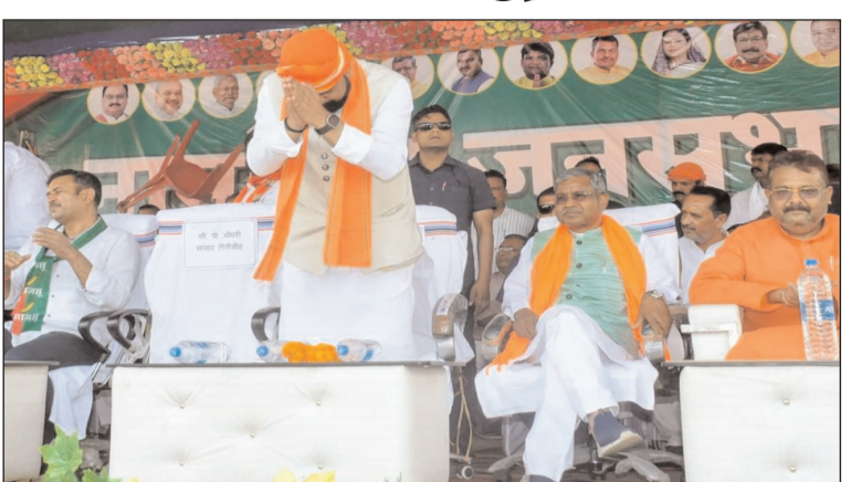
प्रधानमंत्री नरेंद्र मोदी जी की गारंटी है कि भ्रष्टाचार करने वाला कोई बच नहीं जाएगा। इन लूटने वालों पर जब सरकार कार्रवाई करती है तो तो दर्द तो होगा ही। ये इसी लूट से छुटकारा पाने के लिए इंडी गठबंधन बनाया है। लेकिन, इन्हें नहीं पता कि जनता सब देख रही है।

पटना, (संवाददाता)। भाजपा के अध्यक्ष और बिहार के उप मुख्यमंत्री सम्राट चौधरी सोमवार को भ्रष्टाचार के मुद्दे पर इंडी गठबंधन में शामिल राजद और झारखंड मुक्ति मोर्चा (झामुमो) को आड़े हाथों लेते हुए कहा कि झारखंड के पूर्व मुख्यमंत्री शिबू सोरेन ने झारखंड को और बिहार के पूर्व मुख्यमंत्री लालू प्रसाद यादव ने बिहार को लूटा है। श्री चौधरी ने साफ लहजे में कहा कि ये लुटेरे हैं। लालू प्रसाद हों या शिबू सोरेन हो, ये देश को लूटने वाले हैं। उन्होंने कहा कि इनके पुत्र भी अपने पिता की राह पर चल रहे हैं। श्री चौधरी ने स्पष्ट कहा कि लालू प्रसाद खुद चारा घोटाले में सजायापता है जबकि उनके पुत्र समेत परिवार के कई सदस्य जमानत पर हैं। इधर शिबू सोरेन के पुत्र हेमंत सोरेन जेल में हैं। उप मुख्यमंत्री श्री चौधरी ने कहा कि