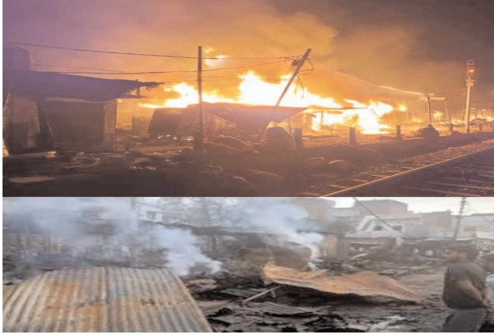
फायर विग्रेड की गाड़ियाँ हाथरस मथुरा मार्ग पर खड़ी होकर रेलवे लाइन के ऊपर से पानी के पाइप से आग बुझा रही थी। इस दौरान कासगंज की तरफ

कस्बा राया में रेलवे लाइन के सहारे काठ के खोखों में आग लगने की वजह से रेल संचालन करीब दो घण्टे बन्द रहा। अंदर जगह न होने के कारण