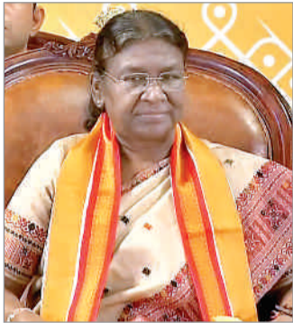
बताया कि सोमवार को सीयू में सातवें दीक्षांत समारोह में राष्ट्रपति