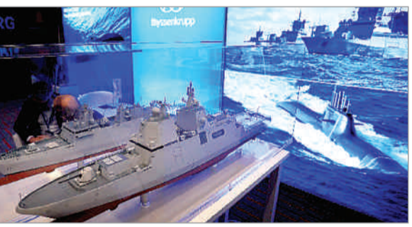
■ भारतीय नौसेना ने 60 हजार करोड़ रुपये के टेंडर जारी करके शुरू की प्रक्रिया ■ मझगांव डॉकयार्ड लिमिटेड में लार्सन एंड टुब्रो करेगा इन पनडुब्बियों का निर्माण

एजेंसी नयी दिल्ली : जर्मन पनडुब्बी निर्माता कम्पनी थिसेनक्रूप मरीन सिस्टम्स के सहयोग से भारतीय नौसेना के लिए छह अत्यधिक उन्नत पनडुब्बियों का निर्माण भारत में ही किया जायेगा। भारतीय नौसेना को 2020 से ही छह पनडुब्बियों के लिए विदेशी पार्टनर की तलाश थी। अब इन छह पनडुब्बियों का निर्माण भारतीय शिपयार्ड मझगांव डॉकयार्ड लिमिटेड में लार्सन एंड टुब्रो की सझेदारी में किया जाना फाइनल हो गया है। नौसेना ने इसके लिए 60 हजार करोड़ रुपये के टेंडर जारी करके पनडुब्बियों के निर्माण के लिए परीक्षण शुरू कर दिया है। पारम्परिक पनडुब्बी बेड़े के आधुनिकीकरण की दिशा में काम