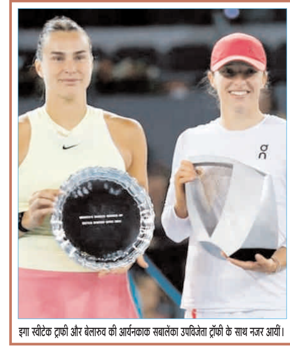
झा स्रीकेट ट्राफी और बेतारव की आर्यकाक सबलैका उपविजेता ट्राफी के साथ नजर आयीं।

दस टीमों 18 दिनों में दो स्थानों ढाका में शेर बांग्ला राष्ट्रीय क्रिकेट स्टेडियम और सिलहट में सिलहट अंतरराष्ट्रीय क्रिकेट स्टेडियम में 23 मैच खेलेगी। 2023 विश्व कप उपविजेता दक्षिण अफ्रीका टूर्नामेंट के