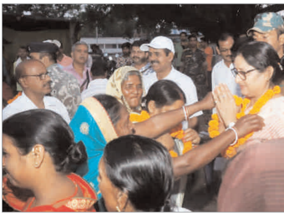
अदालत के फैसले को पलटकर, इमरजेंसी लगाकर

फ्रीडम फाइटर संवाददाता कोडरमा : केन्द्रीय शिक्षा राज्य मंत्री एवं कोडरमा संसदीय क्षेत्र से भाजपा प्रत्याशी अन्नपूर्णा देवी ने कहा कि प्रधानमंत्री श्री नरेंद्र मोदी के कड़े और बड़े फैसलों से देश की जनता तो खुश है लेकिन लुटेरों और ठगों की नींद हराम हो गयी है इनमें से कुछ जेल में हैं, कुछ बेल पर हैं और कुछ लोगों को जेल जाने का डर सता रहा है यही वजह है कि मतलबपरस्त गठबंधन बनाकर सारे चोर इकट्ठा हो गए हैं और किसी भी कीमत पर मोदी जी को प्रधान सेवक की भूमिका से बेदखल करना