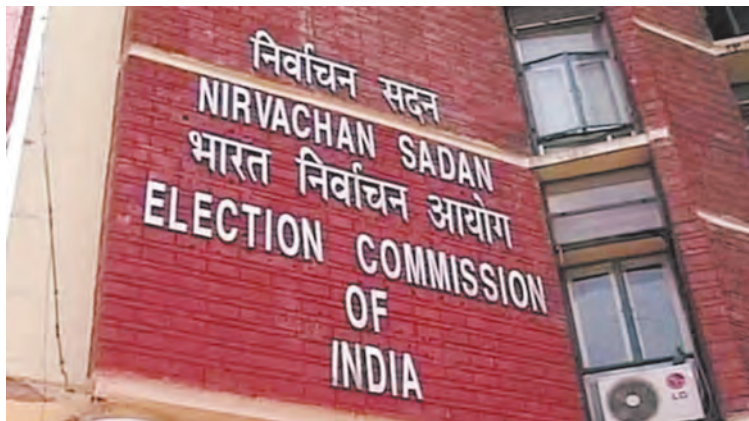
हर घंटे मतदान के आंकड़े जारी किए जाते हैं। रजिस्टर में दर्ज संख्या से मिलान करने के बाद ही हालांकि अंतिम आंकड़ा मतदान अधिकारियों के तय होते हैं।

संख्या क्यों नहीं बताई है। इस तरह चुनाव नतीजों में गड़बड़ी की शंका भी जाहिर की जाने लगी है। पहले ही विपक्षी दल और कई सामाजिक संगठन मतदान मशीनों में गड़बड़ी की आशंका जताते रहे हैं। निर्वाचन आयोग के चुनाव प्रक्रिया और परंपराओं का उचित निर्वाह करने से उनका संदेह स्वाभाविक रूप से और गहरा होगा। यह समझना मुश्किल है कि निर्वाचन आयोग ने मतदान के अंतिम आंकड़े जारी करने में इतना वक्त क्यों लगाया। मशीनों के जरिए मतदान कराने के पीछे मकसद यही था कि इससे मतगणना में आसानी होगी, मतदान से संबंधित आंकड़ों को अधिक पारदर्शी और विश्वसनीय बनाया जा सकेगा। मतदान मशीनों की केंद्रीय इकाई में हर मतदान केंद्र पर पड़ते मशीनों की संख्या दर्ज होती है। इस तरह