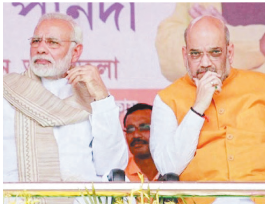
पदाधिकारियों के बयानों का हवाला देकर भाजपा की नियत पर सवाल उठाया जाता रहा है।

राहुल गांधी ने इस लोकसभा चुनाव में आरक्षण के मुद्दे को भय में बदल दिया है। लगातार दो चुनाव हारने के बाद कांग्रेस को यह समझ में आ गया कि निम्न वर्ग, जिनमें एएससी, एएसटी, ओबीसी और मुस्लिम आते थे, धीरे धीरे कांग्रेस से छिटक गए हैं। 1990 से 1996 तक ये सभी वर्ग जाति आधारित क्षेत्रीय पार्टियों के साथ जुड़ गए थे।