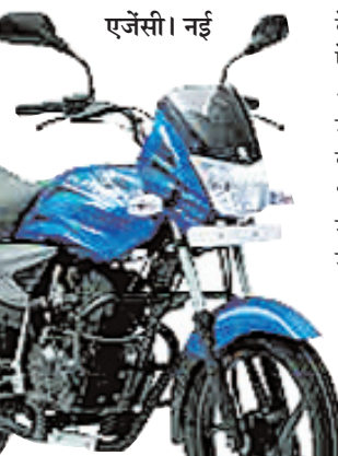
एजेंसी। नई दिल्ली। भारतीय बाजार में सबसे सस्ती 400 सीसी मोटरसाइकल पल्सर एनएस400जी लॉन्च करने

नई दिल्ली। डीपफेक के कई मामलों ने दुनियाभर में काफी सुर्खियों बटोरी हैं। वहीं कई एक्सपर्ट्स व सेलेब्रिटीज ने इस मसले पर अपनी-अपनी चिंताएं भी व्यक्त की हैं। डीपफेक के खतरों को मात देने के लिए अब दिग्गज सोशल मीडिया कंपनी के सीईओ ने अपडेट दी है। न्यूज एजेंसी कश्कर के मुताबिक टेस्ला और स्पेसएक्स के सीईओ एलन मस्क ने शनिवार को कहा कि एक्स पर इम्पूवर्ड इमेज मैचिंग का एक नया अपडेट लॉन्च किया जा रहा है जो सोशल मीडिया प्लेटफॉर्म पर डीपफेक के साथ-साथ शैलोफेक की भी निगरानी करेगा। एक्स ने एक पोस्ट में कहा कि, हमने अभी अपडेट जारी किया है, जो किसी भी फर्जी इमेज को निगरानी करेगा। मस्क ने कहा कि इस कदम से डीपफेक को हराने में मदद मिलेगी। शैलोफेक्स ऑटोफिशियल इटैलिजेंस या अक की मदद के बिना तैयार की गई फोटोज, वीडियो और वॉयस क्लिप हैं, और व्यापक रूप से उपलब्ध एडिटिंग और साॉफ्टवेयर टूल का इस्तेमाल करते हैं। बता दें कि देश में इन दिनों चुनावी मौसम चल रहा है। ऐसे में एक्सपर्ट्स ने फर्जी खबरों और डीपफेक के प्रसार के बारे में चेतावनी दी है, जिसका उद्देश्य चुनाव को प्रभावित करना है। इंडिपेंडेंट ओवरसाइट बोर्ड ने वैश्विक चुनावों को खतरों में डालने वाले डीपफेक से निपटने के लिए तत्काल कार्रवाई का आह्वान किया है।