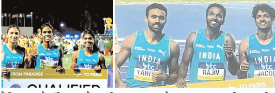
पेरिस ओलंपिक के लिए क्वालीफाई किया। महिलाओं के टूर्नामेंट की हीट नंबर एक में जैमैका (3:28.54)

एजेंसी। नई दिल्ली। पेरिस ओलंपिक के लिए भारत की पुरुष एवं महिला रिले टीम ने क्वालीफाई कर लिया है। 4 गुणा 400 मीटर रिले टीमों (महिला और पुरुष दोनों) ने सोमवार को बहामास के नासाऊ में आयोजित विश्व एथलेटिक्स रिले में अपने-अपने दूसरे दौर की हीट में दूसरा स्थान हासिल कर