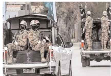
पाकिस्तानी सेना के सबसे बड़े सेक्स कैंडिड का खुलासा हुआ है। खैबर पख्तूनख्वा के कबालाई इलाक़े में तैनात कर्तल से पेंडेंट तक के कुछ अफसरों के बच्चों से यौन शोषण के 600 से ज्यादा वीडियो सामले आए हैं।

100 बच्चों के 600 वीडियो सामले आए; सेना ने आरोप खारिज किए इस्लामाबाद, एजेंसी। पाकिस्तानी सेना के सबसे बड़े सेक्स कैंडिड का खुलासा हुआ है। खैबर पख्तूनख्वा के कबालाई इलाक़े में तैनात कर्तल से पेंडेंट तक के कुछ अफसरों के बच्चों से यौन शोषण के 600 से ज्यादा वीडियो सामले आए हैं। लगभग 14 साल से कम बच्चाई गई है। लगभग 14 साल से कम बच्चाई गई है। लगभग 14 साल से कम बच्चाई गई है। लगभग 14 साल से कम बच्चाई गई है।