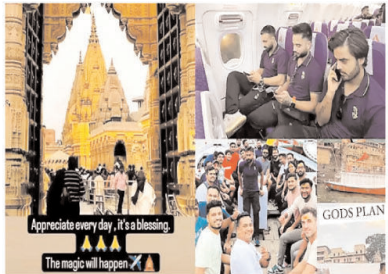
नई दिल्ली (एजेंसी)। लखनऊ सुपर जायंट्स को रिविंजर की 98 रन से हराने के बाद श्रेयस अय्यर को कप्तानी