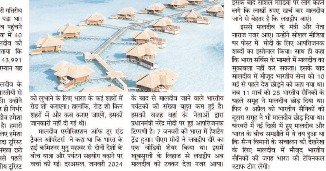
इसके बाद सोशल मीडिया पर लोग कहने लगे कि लाराओं रूप खर्च कर मालदीव जाने से बेहतर है कि लक्षद्वीप जाएं।