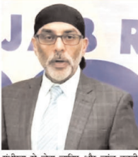
गोमरिला से लेना चाहिए और जांच करनी चाहिए।