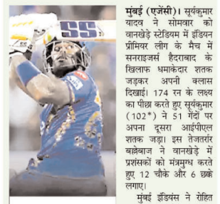
मुंबई (एजेंसी)। सूर्यकुमार यादव ने सोमार को वानखेड़े स्टेडियम में इंडियन प्रीमियर लीग के बीच में सगराजजन हेतुबाद के खिलाफ धमकेदार शतक जड़कर अपनी बलबात दिखाई। 174 रन के साथ का पीछ करतें हुए सूर्यकुमार (102*) ने 51 गेंदों पर अपना दूसरा आइपीएल शतक जड़ा। इस तेजतर्रार बल्लेबाज ने वानखेड़े में प्रसन्नता से संभ्रमण करते हुए 12 चौके और 6 छके लगाए।