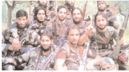
तारफ से मिल रही गैर-भरतानी की तरह है। ताजा हमला उसी इलाके में हुआ है। वह पाकिस्तान से

आतंकी पाकिस्तान से आए थे। उनमें से दो आतंकियों के रेखाचित्र जारी कर उनके बारे में जानकारी देने वाले को बीस लाख रुपए इनाम की घोषणा भी कर दी गई है। सरकार लगातार कहती आ रही है कि घाटी में आतंकियों की गतिविधियों को समेट दिया गया है। अब वे एक सीमित क्षेत्र में सक्रिय रह गए हैं। उन्हें भी जल्दी खत्म कर दिया जाएगा। मगर घाटी की बात है कि सरकार के इस दावे को ध्यान में रखते हुए आतंकी लगातार कभी लखित हिंसा करके ध्यान भंग कर सकते हैं, तो कभी सेना के कॉन्फ्लिक्ट पर बात लगा कर हमला करने में कैसे कामयाब हो जा सके हैं। चिंता की बात यह भी है कि आतंकी उन इलाकों में भी सक्रिय देखे जा रहे हैं, जहाँ वर्षों से लगभग शांति थी। पौर-पंजाल के इलाके में फिर से आतंकियों का सक्रिय हो जाना पाकिस्तान को