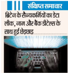
ब्रिटेन के सेन्यकारियों का डेटा लीक, नाम और बैंक डीटल्स के साथ हुई छेड़छाड़

संक्षिप्त समाचार ब्रिटेन के सेन्यकारियों का डेटा लीक, नाम और बैंक डीटल्स के साथ हुई छेड़छाड़ लंदन, एजेंसी। बीबीसी को एक रिपोर्ट के अनुसार, ब्रिटेन के रक्षा विभाग द्वारा इस्तेमाल की जाने वाली पेंसेल प्रणाली में कुछ व्यक्तिगत जानकारी डेटा लीक में देखी गई है। इसका मतलब है कि प्रणाली का प्रबंधन एक बाहरी डेवलपर द्वारा किया गया था और रक्षा मंत्रालय का कोई परिचायन डेटा नहीं मिला था। रिपोर्ट के अनुसार, वर्तमान कुछ पूर्व सेन्यकारों, सेना और वायु सेना के सदस्यों के नाम और बैंक विवरण के साथ छेड़छाड़ हुई थी। रक्षा मंत्रालय ने काम के निष्पत्ति समय के बाद टिप्पणी के लिए रिपोर्ट के अनुरोध का तुरंत जवाब नहीं दिया। रिपोर्ट में कहा गया है कि संसदों को मंत्रालय को सूचना में इस घटनाक्रम के बारे में सुनिश्चित किया जा सकता है। अमरीका में महिला की 10 सप्ताह में दूसरी बार गर्भ 1 मिलियन डॉलर की लॉटरी