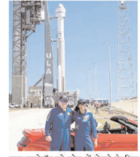
पास एस्ट्रोनाट को स्पेस में भेजने के लिए 2 संसद्धार हो जाएंगे। अभी अमेरिका के पास लॉन्च करने की कम्पनी स्पेसएक्स का ड्रैगन स्पेसक्राफ्ट ही है।