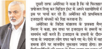
नेटजॉरिम कौरीडो से इजराइली सेना की सामग्री होगी। न्यूज एजेंसी.इ.के के मुताबिक, इजराइल टैंक गाजा-मिस्र की सीमा से सिर्फ 200 मीटर की दूरी पर थे।