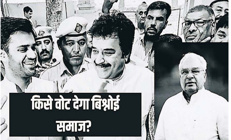
कैसे वोट देगा बिश्नोई समाज?

लगभग तीन दशक पहले भजन लाल बिश्नोई के तीन बार मुख्यमंत्री रहने का दौर जब खत्म हुआ तब से राजनीति में बिश्नोई परिवार का प्रभाव कम होने लगा। हरियाणा में पूर्व सीएम भजनलाल परिवार का काफी राजनीतिक महत्व माना जाता है। हरियाणा की राजनीति से जुड़ा सवाल यह है कि 2024 के आम चुनाव में बिश्नोई मतदाताओं और नेताओं का क्या रुख है? वह किस राह जाएंगे और किस वोट करेंगे? चर्चा यह है कि हरियाणा की 10 लोकसभा सीटों पर दोनों पार्टियों के प्रत्याशी घोषित होने के बाद सबसे ज्यादा नुकसान में पूर्व मुख्यमंत्री भजनलाल बिश्नोई का परिवार है, जिनका अभी भी बिश्नोई मतदाताओं पर काफी प्रभाव माना जाता है। पूर्व सीएम के दोनों बेटे अब अलग-अलग सियासी दल में हैं। एक कांग्रेस के लिए प्रचार कर रहा है और दूसरा बीजेपी से नाराज बताया जाता है, और खामोश है। इसलिए इस बार स्थिति बहुत स्पष्ट नहीं दिखाई दे रही है। हम इस आर्टिकल में आगे सिरसा लोकसभा के आकलन से इसे आसानी से समझ सकेंगे। क्यों नाराज हैं कुलदीप बिश्नोई? पूर्व मुख्यमंत्री भजन लाल के बेटे कुलदीप बिश्नोई को नरेंद्र हिसार लोकसभा सीट पर था। लेकिन बीजेपी ने उन्हें टिकट ना देते हुए राज्य के बिजली मंत्री राजीत सिंह चोटावाला को मैदान में उतार दिया। ऐसा भी कहा जा रहा था कि कुलदीप बिश्नोई को राजस्थान में भाजपा के उम्मीदवारों की लिस्ट में जगह मिलने की उम्मीद थी, जहाँ उनके समुदाय का