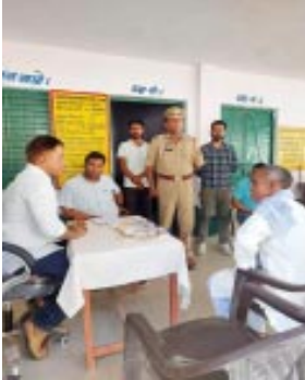
सामान्य प्रेक्षक ने बूथों पर