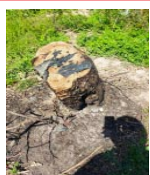
गुधनी के बताए जा रहे हैं, जिसकी शिकायत करने के बाद भी कोई