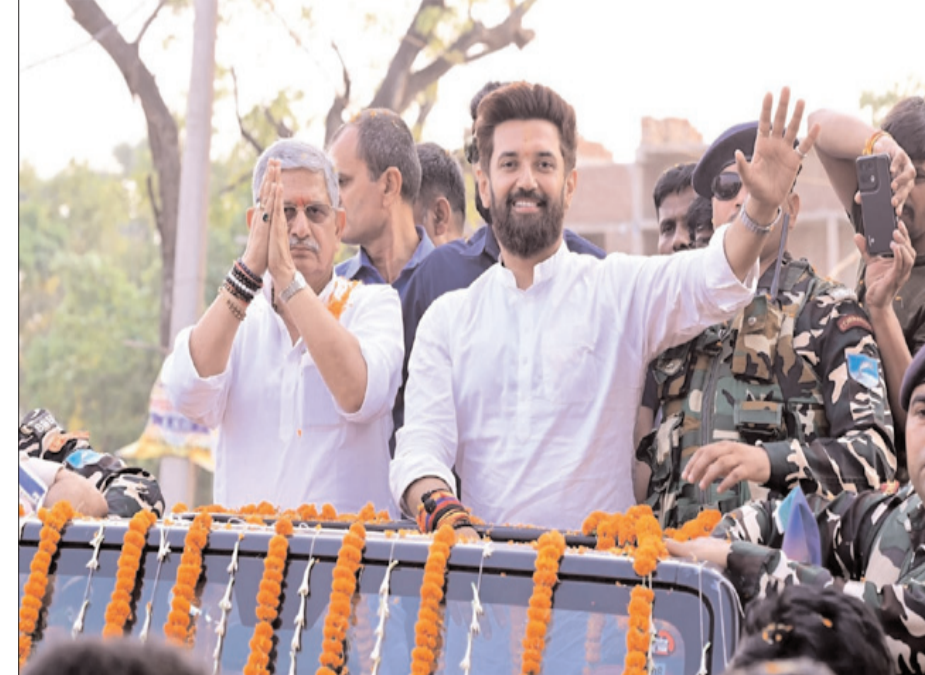
मुंगेर में रोड शो करते हैं लोजपा रामविलास के राष्ट्रीय अध्यक्ष चिराग पासवान साथ में मुंगेर लोकसभा के प्रत्याशी राजीव रंजन उर्फ ललन सिंह।