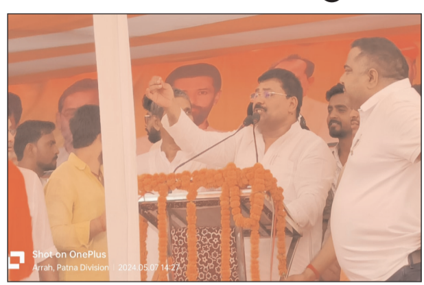
नीतीश कुमार को समाज के हर वर्ग की चिंता है। हमारे दोनों नेता सभी की तरक्की के लिए दिनरात लगे रहते हैं, जबकि विपक्षी पार्टियां सिर्फ अपने परिवार को आगे बढ़ाने की चिंता है। हमारे दोनों नेता सभी की तरक्की के लिए दिनरात लगे रहते हैं, जबकि विपक्षी पार्टियां सिर्फ