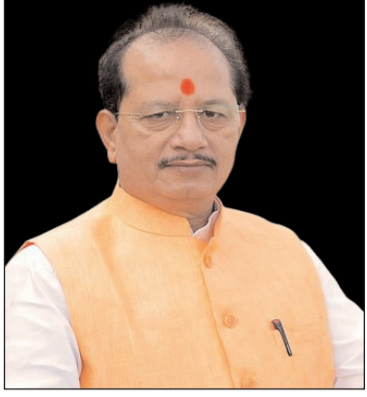
की सरकार अपनी योजनाओं को सबका साथ सबका विकास के संकल्प के साथ सभी 140 करोड़ देशवासियों तक पहुंचा है। चाहे गरीब कल्याण योजना हो, प्रधानमंत्री आवास योजना हो, मुद्रा योजना हो, उच्चला योजना हो या फिर आर्थिक

पटना (नव शक्ति संवाददाता)। बिहार के उपमुख्यमंत्री विजय कुमार सिन्हा ने कहा कि लालू प्रसाद यादव का मुसलमानों को आरक्षण देना यह बताता है कि राजद-कांग्रेस गठबंधन पूरी तरह से मुस्लिम लीग के रास्ते पर चल रहा है। वे लोग संविधान और लोकतंत्र की बात करके उसकी आड़ में देश में धार्मिक उन्माद फैलाकर केवल अपनी राजनीति की रोटी सेंकना चाहते हैं। श्री सिन्हा ने आगे कहा कि लालू जी को पता होना चाहिए कि हमारे संविधान में धार्मिक आधार पर किसी को आरक्षण देने की बात नहीं की गई है और न ही हमारी लोकतांत्रिक व्यवस्था में धार्मिक विभाजन का कोई प्रावधान है। श्री सिन्हा ने कहा कि मोदी जी