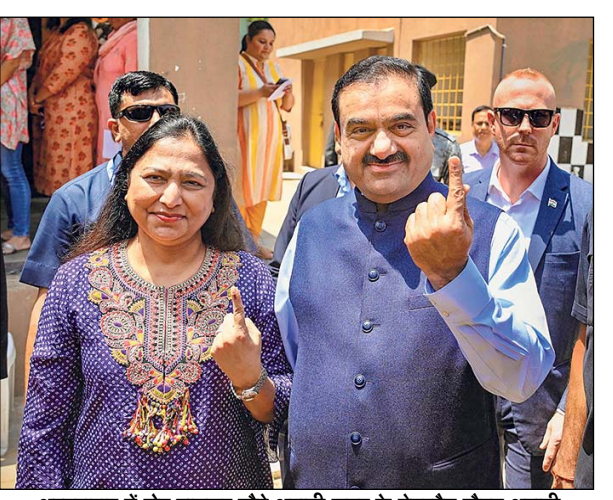
अहमदाबाद में केंद्रीय गृह मंत्री अमित शाह अपनी पत्नी, बेटे और बहू के साथ।