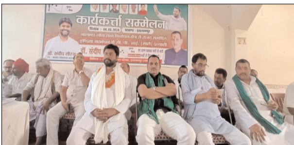
देश अंदर युवाओं को बेरोजगारी की अंधेरे में धकेल दिया गया। लेकिन सबको पता है की देश में 30 लाख सरकारी नौकरी के पद खाली पड़े रहते हुए देश के युवा लोग बेरोजगार होकर इधर उधर नौकरी के लिए घटक रहे हैं। मोदी सरकार कांपोर्ट घरानों को मदद कर रही है। हमे जीतने के लिए इस चुनाव आप लोग को ज्यादा जोर लगाना होगा इसलिए इस बार देश को बचाना है। विपक्ष

सारे विपक्ष के नेताओं को जेल अंदर डाल दो, विपक्ष में कोई नेता ही नहीं बचे, वह भाजपा की सोच है। चुनाव में जनता के अधिकारों को भी छिनने की साजिश रची जा रही है। 2024 का लोकसभा का चुनाव देश के लोकतंत्र को बचाने का हमलोगों के पास आखरी मौका है इसलिए हम लोग को चुकना नहीं है। 2014 के चुनाव में भाजपा द्वारा जबरदस्त प्रचार किया गया था की बहुत हुई महंगाई की मार अबकी बार मोदी सरकार, बहुत हुआ नारी पर वार अबकी बार मोदी सरकार और महंगाई की मार आज देश अंदर सभी लोग झेल रहे हैं। महिला पहलवानों के साथ अश्लील हरकत करने वाले भारतीय कुश्ती संघ के अध्यक्ष बृज भूषण सिंह के निर्देश पर उसके पुत्र को लोकसभा का टिकट देकर सम्मानित करने का काम किया है।