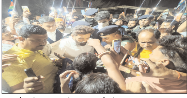
हाजीपुर। हाजीपुर लोकसभा क्षेत्र अर्न्तगत लालगंज प्रखंड के लखन सराय एवं सहदुल्लाहपुर में बीते दिन अगलगी में तकरीबन 50 घर जल गये थे सूचना मिलते ही लोक जनशक्ति पार्टी रामविलास राष्ट्रीय अध्यक्ष एवं हाजीपुर से एनडीए समर्थित उम्मीदवार आदरणीय श्री चिराग पासवान जी अगलगी की घटना में पीड़ित और प्रभावित परिवारों से मुलाकात कर उनके कुशल से पूछा और संवेदना व्यक्त की। इस अगलगी की घटना में प्रभावित सभी घायलों को जल्द से जल्द स्वस्थ होने की उन्होंने प्रार्थना की। पार्टी के मुख्य प्रवक्ता राजेश भट्ट ने बताया कि मौके पर मुख्य रूप से पार्टी के राष्ट्रीय सचिव सह हाजीपुर लोकसभा प्रभारी श्री अरविन्द कुमार

वोट की खातिर लोगों को आपस में लड़वाने में लगे हुए हैं, मेरा प्रयास होगा कि बेहतर समाज का निर्माण हो। उन्होंने कहा कि अपने क्षेत्र की हर समस्या को केंद्र सरकार के समक्ष सदन में रखना और उन समस्याओं के निदान के लिए हमेशा तैयार रहना। चाहे वह जिस भी परिस्थिति में हो, उसका पूरा करने का भरसक प्रयास करूंगा। क्षेत्र भ्रमण के दौरान नालंदा के मतदाताओं का जो प्यार और समर्थन हमें मिल रहा है, उसका मैं तहे दिल से आप सभी मतदाताओं का आभारी हूँ। मुझे पूर्ण विश्वास है कि इसी तरह आप सभी का प्यार और समर्थन मुझे आगे भी मिलता रहेगा।