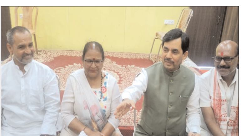
करते हुए कहा कि कांग्रेस ने अपने शासन काल में देश भर में कांटा बोया था जिसे देश के प्रतापी प्रधानमंत्री नरेंद्र मोदी ने अपने दस सालों के शासन काल में चुनने का कार्य किया। आज विश्व भर में मोदी की गारंटी चल रही है। कांग्रेस की गारंटी झूठ का गारंटी