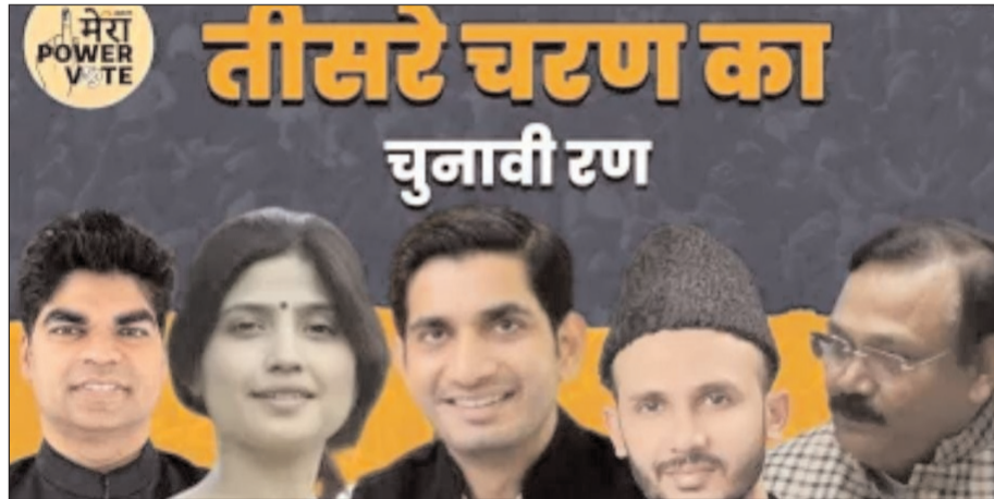
मैनुपुरी में सपा प्रमुख अखिलेश यादव की पत्नी डिंपल यादव के खिलाफ योगी सरकार के पर्यटन मंत्री जयवीर सिंह चुनाव मैदान में हैं