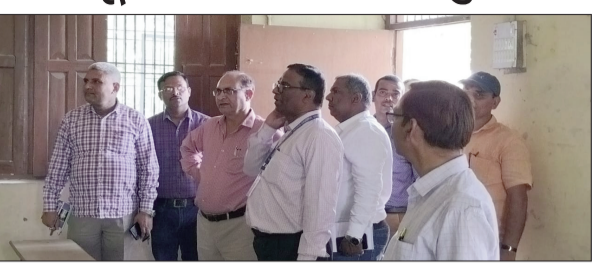
लोकतंत्र की आवाज