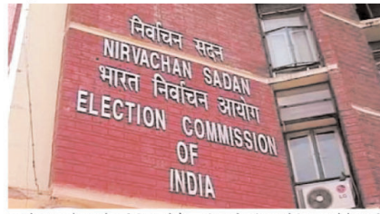
हर घंटे मतदान के आंकड़े जारी किए जाते हैं। हालांकि अंतिम आंकड़ा मतदान अधिकारियों के रजिस्टर में दर्ज संख्या से मिलान करने के बाद ही तय होते हैं।

संख्या क्यों नहीं बताई है। इस तरह चुनाव नतीजों में गड़बड़ी को शंका भी जाहिर की जाने लगी है। पहले ही विपक्षी दल और कई समाजिक संगठन मतदान मशीनों में गड़बड़ी की आशंका जताते रहे हैं। निर्वाचन आयोग के चुनाव प्रक्रिया और पर्यवेक्षण का उचित निरीक्षण करने से उनका संदेह व्यापक रूप से और गहरा होगा। यह समझना मुश्किल है कि निर्वाचन आयोग ने मतदान के अंतिम आंकड़े जारी करने में इतना वकत क्यों लगाया। मशीनों के जरिए मतदान करने के पीछे एक संकेत यह था कि इससे मतदाताओं में आसानी होगी, मतदान से संबंधित आंकड़ों को अधिक पारदर्शी और विश्वसनीय बनाया जा सकेगा। मतदान मशीनों की केंद्रीय इकाई में हर मतदान केंद्र पर पड़े मतों की संख्या दर्ज होती है। इस तरह