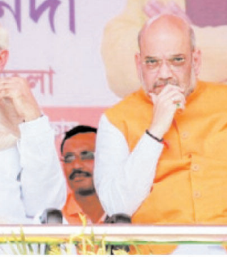
ही गोपनीय तरीके से एस्सी, एस्टी और ओबीसी में यह अफवाह उड़ाई गई कि मोदी जो यह कह रहे हैं कि 400 सीटें हॉलिल करने के बाद वह बहुत बड़ा काम करे, अभी तो टि्वट दिखावा है, पिक्चर अभी बाकी है, उनके इस वाक्यों का मतलब यह है कि 400 सीटें हॉलिल करने के बाद वह सविधान बदल देंगे और जाति आधारित आरक्षण खत्म कर देंगे। अपनी बात को सही साबित करने के लिए कांग्रेस और उसके सहयोगियों ने ऑर्गिनायल टि्वटलेजेंस का इस्तेमाल करते हुए अमित शाह की ऐसी एडिटेड वीडियो बनाई, जिसमें उन्हें कहते हुए दिखाया गया है कि भाजपा सत्ता में आने ही एस्सी, एस्टी और ओबीसी का आरक्षण खत्म कर देगी। प्रधानमंत्री नरेंद्र मोदी को दूसरे चरण का मतदान हो जाने के बाद समझ में आया कि अंडर करत भी चल रहा है और वचन चल रहा है, राजस्थान से यह खबर क्यों आई है कि आरक्षण वाली रजिस्ट्रारियों ने उसके खिलाफ वोट किए हैं और उसकी वार से अनेक अंडर सीटें खरते में आ गई हैं। इसलिए मोदी को अतिवृत्त शाह इलाकर और आरक्षण मुद्दे में आ कर साराहं दे रहे हैं। मोदी को यह कहना पड़ा कि वह तो वचन डालकर आम्बेडकर भी सविधान नहीं बदल सकते। उन्हें समझने दी पड़ रही है कि वे एस्सी, एस्टी और ओबीसी का आरक्षण बनाए रखेंगे, अलबत्ता कांग्रेस ने जिन मुस्लिम जातियों को ओबीसी में शामिल करके ओबीसी का रूक मारा है, वह उसे वापस दिखाएंगे। भाजपा मुस्लिम आरक्षण को मुद्दा बना कर एस्सी, एस्टी और ओबीसी वर्गों में पेटा हुए भ्रम को दूर करने की कोशिश में जुट गई, लेकिन वह कितना कामयाब होगा यह खबर नतीजे ही बताएंगे। यह खबर है कि कांग्रेस बहुत ही सलाके से और चुपके से आरक्षण के मुद्दे पर काम कर रही है। जाति आधारित जिस मुद्दे को मोदी और शाह कलंक में लेते रहे थे, वही आरक्षण का मुद्दा चुनाव के मध्य में भाजपा के जी का जंजाल बन गया है।

राहुल गांधी ने इस लोकसभा चुनाव में आरक्षण के मुद्दे को मध्य में बदल दिया है। लगातार दो चुनाव हारने के बाद कांग्रेस को यह समझ में आ गया कि निम्न वर्ग, जिनमें एस्सी, एस्टी, ओबीसी और मुस्लिम आते थे, धीरे धीरे कांग्रेस से छिटक गए हैं। 1990 से 1996 तक ये सभी वर्ग जाति आधारित क्षेत्रीय पार्टियों के साथ जुड़ गए थे। 1996 के बाद एस्सी, एस्टी भाजपा के साथ जुड़ना शुरू हुआ, लेकिन ओबीसी और मुस्लिम गैर भाजपा पर कांग्रेस क्षेत्रीय दलों के साथ जुड़ गए। इस दौर में उत्तर प्रदेश और बिहार में एमएचडी फार्मूले के तहत जाति आधारित पार्टियों का दबदबा बना रहा। 2014 में एस्सी एस्टी के बाद ओबीसी भी भारतीय जनता पार्टी के साथ जुड़ना शुरू हो गया, जो 2019 में लगभग भाजपा का कोर वोट बन गया था। कांग्रेस को यह समझ में आ गया था कि जब तक वे सभी वर्गों के साथ नहीं जुड़ते, तब तक वह भाजपा का चक्रव्यूह नहीं तोड़ सकता। इसलिए राहुल गांधी ने सबसे पहले कांग्रेस की पुनर्-नीति से हटते हुए जाति आधारित जनगणना की मांग उठाई और वादा किया कि जब कांग्रेस सत्ता में आएगी तो जाति आधारित जनगणना करवा कर एस्सी, एस्टी और ओबीसी को उनकी संख्या के अनुपात में आरक्षण दिया जाएगा। कांग्रेस की यह बदली हुई नीति इन तीनों वर्गों की प्रभावित करती है। दूसरा काम कांग्रेस ने यह किया कि कर्नाटक और तेलंगाना में मुसलमानों की सभी जातियों को ओबीसी में शामिल कर लिया। तो जो कांग्रेस का मूल वोट बैंक था, एस्सी, एस्टी, ओबीसी और मुस्लिम, इन चारों वर्गों को कांग्रेस ने अपनी ओर आकर्षित करना शुरू कर दिया है। अब इसके बाद जुनूरी या आरक्षण के मुद्दे पर भाजपा की विश्वसनीयता पर सवाल उठाना, तो बहुत