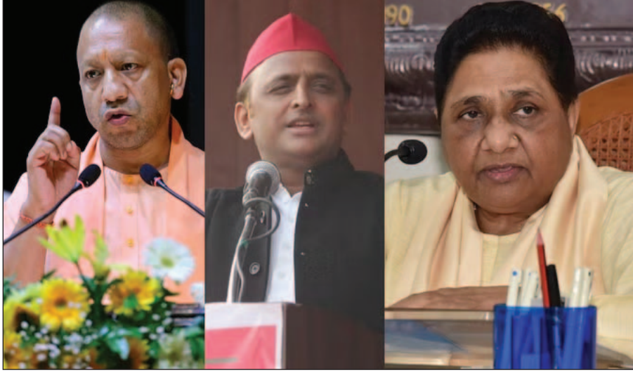
फिर जलपान! जय हिंद!

सभी सम्मानित मतदाताओं से मेरी अपील है कि 'आत्मनिर्भर भारत' एवं 'विकसित भारत' के निर्माण के लिए, 'नए भारत' की अविराम विकास यात्रा के लिए मतदान अवश्य करें। आपका एक वोट 'भारत' को और अधिक सशक्त बनाएगा। इसलिए ध्यान रहे, पहले मतदान,