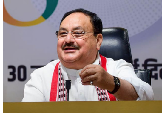
देली खबर 99- स्पेशल डेस्क