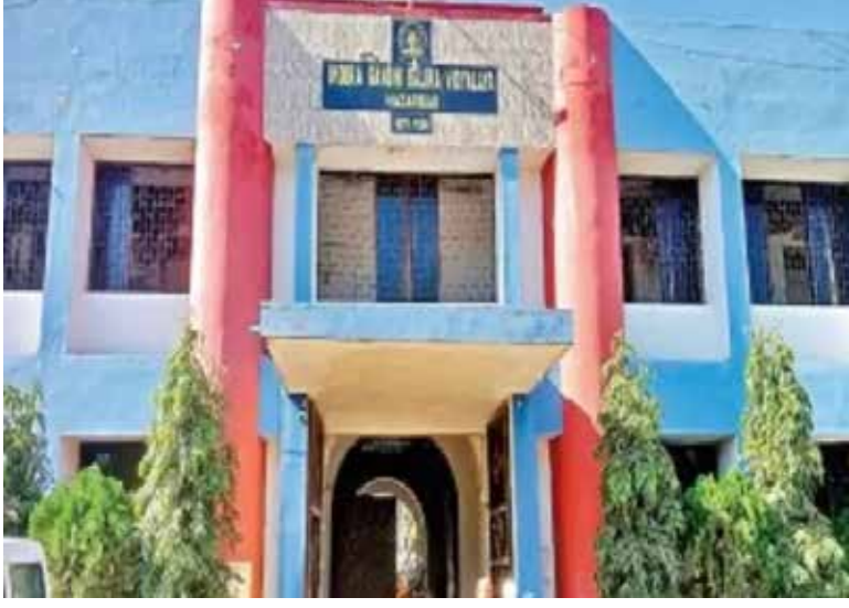
शिक्षक ही नहीं शिक्षकेतर कर्मचारियों के भी आधे पद खाली हैं। जबकि गैर-विद्यालय की स्थापना संयुक्त बिहार के समय हुई थी। इसकी स्थापना नेतरहाट आवासीय विद्यालय की तर्ज पर छात्राओं के लिए की गई थी। स्कूल में शिक्षकों का एक अलग कैडर है। इसकी भर्ती प्रक्रिया भी अलग है और दूसरे स्कूल में स्थानांतरण भी संभव नहीं है। पहले पढ़ाई कक्षा 6 से 10 तक थी, अब इसे अपग्रेड कर 12वें कर दिया गया है। कोई स्कूल वेबसाइट नहीं

रांची | इंदिरा गांधी बालिका आवासीय विद्यालय, हजारीबाग की छात्राओं ने जैक मैट्रिक परीक्षा 2024 में शानदार सफलता हासिल की है। राज्य के टॉप टेन में शामिल 44 अभ्यर्थियों में से 19 इसी स्कूल के छात्र हैं। प्रदेश की टॉप थ्री में शामिल चारों लड़कियां इसी स्कूल की हैं। विद्यालय में एक भी स्थायी शिक्षक नहीं है, वर्षों से विद्यालय में किसी शिक्षक की नियुक्ति नहीं की गयी है। विद्यालय में पठन-पाठन की पूरी व्यवस्था प्रतिनियुक्ति शिक्षकों के भरोसे चल रही है। विद्यालय में शिक्षकों के कुल 27 पद सृजित हैं, जबकि मात्र दो स्थायी शिक्षक (हिन्दी व विज्ञान) ही कार्यरत हैं। संयुक्त बिहार के समय अब तक सिर्फ एक बार ही स्कूलों में शिक्षकों की नियुक्ति होती थी। फिलहाल यहां दूसरे स्कूलों के शिक्षक तैनात हैं।