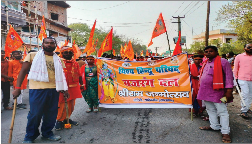
उज्ज्वल दुनिया संवाददाता

बोरियो:- प्रखंड मुख्यालय में रामनवमी पर्व के अवसर पर बुधवार को भव्य श्री राम झांकी निकाली गई। जहां यह झांकी बजरंग दल व विश्व हिंदू परिषद के बैनर तले निकली। इस भव्य झांकी में श्री राम, लक्ष्मण, सीता, बजरंग