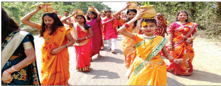
उज्ज्वल दुनिया संवाददाता