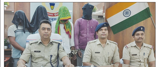
उज्ज्वल दुनिया संवाददाता