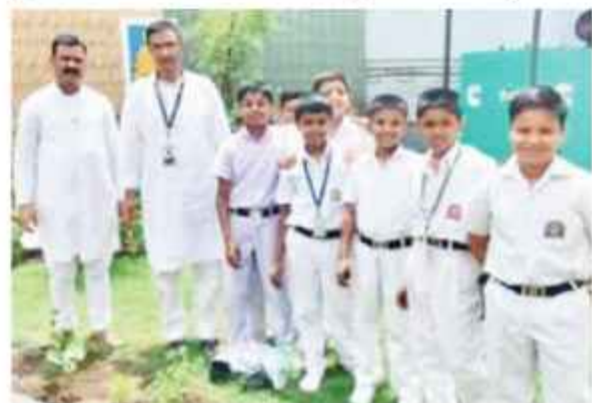
دھنباہ: راج محل سرسوتی و دیامندر، دھنباہ میں آج بچوں کو دلدار بھڑے کے بارے میں معلومات فراہم کی گئیں۔

دھنباہ: راج محل سرسوتی و دیامندر، دھنباہ میں آج بچوں کو دلدار بھڑے کے بارے میں معلومات فراہم کی گئیں۔ بچوں نے سکول میں پورے لگائے۔