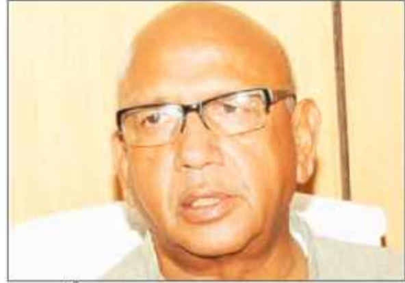
دھنباہ: بھاری جن متز مورچہ کے سرپرست اور جمہور پر ایسٹ کے ایم ایل اے سر یورائے کابی جے پی کے خلاف 19 مقدمات ابھی بھی زیر التوا، الیکشن لڑانے پر کل تک فیصلہ لے پارٹی

ڈھلو ہتھو کے خلاف 19 مقدمات ابھی بھی زیر التوا، الیکشن لڑانے پر کل تک فیصلہ لے پارٹی