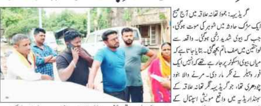
گرڈ پور: بھوات علاقہ میں آج صبح ایک سڑک حادثہ میں شوہر کی موت ہو گئی، جب کہ بیوی شدید زخمی ہو گئی۔

گرڈ پور: بھوات علاقہ میں آج صبح ایک سڑک حادثہ میں شوہر کی موت ہو گئی، جب کہ بیوی شدید زخمی ہو گئی۔ واقعہ سے لوہان میں صدمہ مٹا نہیں ہو سکا۔