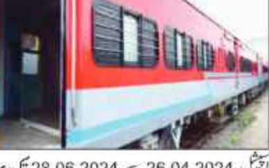
دھنباہ: سفر افروغی کی سہولت کے لیے کوئٹھور - برونی کے درمیان دھنباہ کے راستے ان کے آسان سفر کے لیے ایک خصوصی ٹرین چلائی جائے گی۔