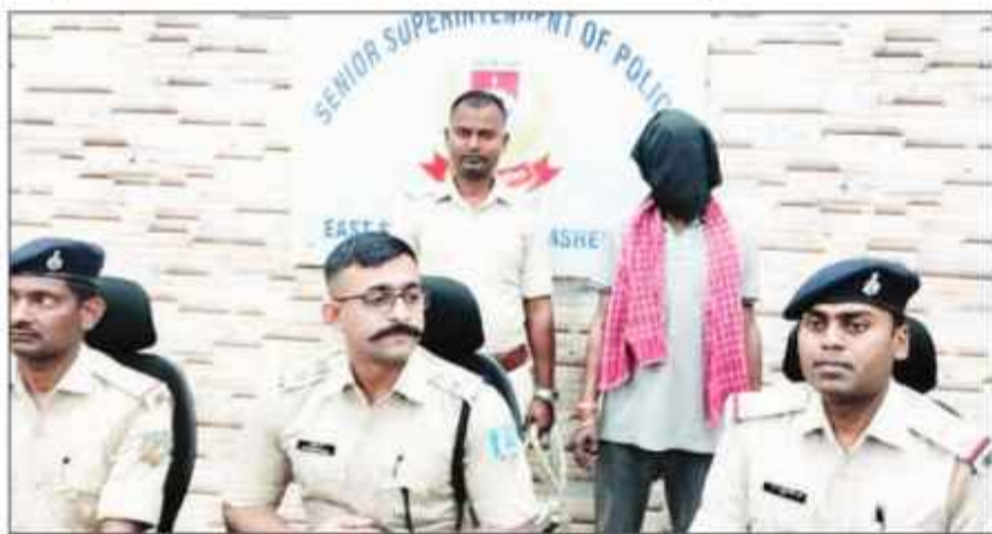
دھنباہ: ایک نو جوان کو ڈیڑھ کلو گانجے کے ساتھ گرفتار کیا گیا۔ پولیس نے اسے جیل بھیج دیا۔