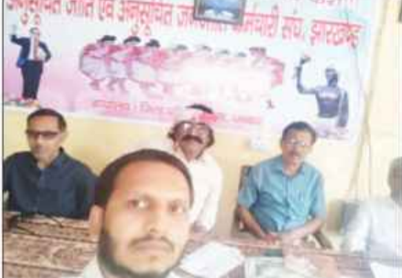
دھنباہ: ایس سی، ایس ٹی اور اوبی سی ملازمین یونین کا اجلاس اختتام پذیر ہوا۔

دھنباہ: ایس سی، ایس ٹی اور اوبی سی ملازمین یونین کا اجلاس اختتام پذیر ہوا۔ اجلاس میں مختلف مسائل پر تبادلہ خیال کیا گیا۔ یونین کے سربراہ نے ملازمین کی مشکلات کو مد نظر رکھنے کی درخواست کی۔