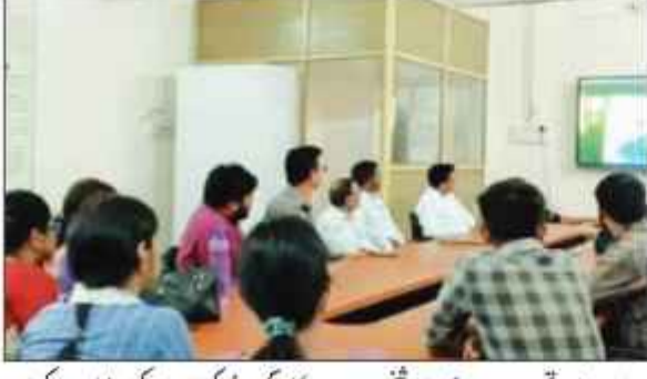
دھنباہ: بی آئی ٹی سندری کے سیمینار میں حکومت کے ساتھ کام کرنے پر تبادلہ خیال کیا گیا۔