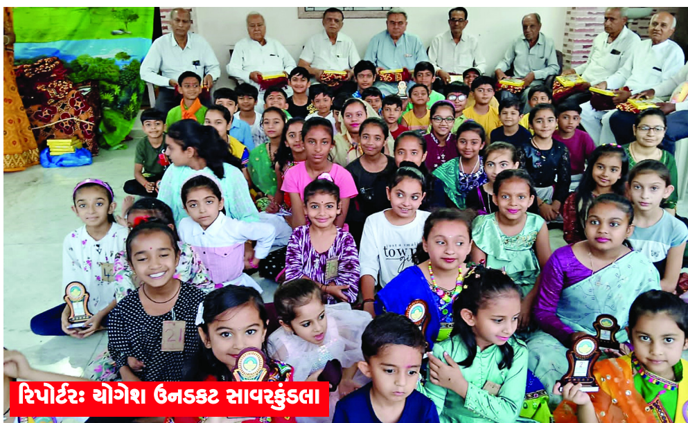
સાવરકુંડલા