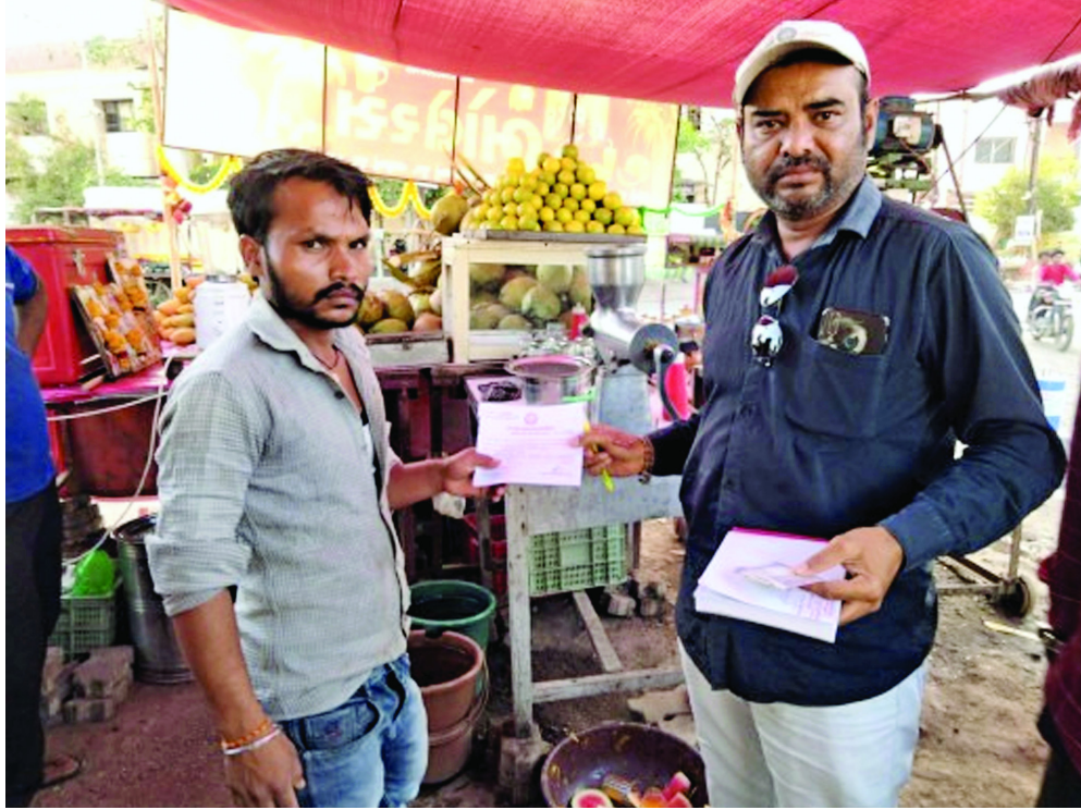
૨૬૬૫૦નો વહીવટી ચાર્જ વસુલ કરવામાં આવ્યો હતો.

જેમાં તા. ૧૬ થી ૧૭ના રોજ ત્રણેય ઝોનમાંથી કુલ ૧૦૧ આસામીઓ પાસેથી ૬.૨૯૫ કી.ગ્રા. પ્રતિબંધીત પ્લાસ્ટિક જમ કરી તથા ગંદકી કરતા આસામી પાસેથી રૂ.