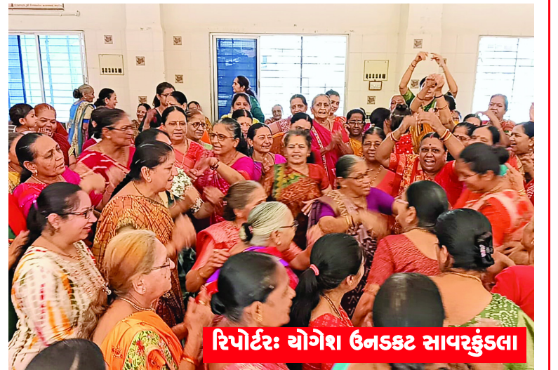
રિપોર્ટર: યોગેશ ઉનડકટ સાવરકુંડલા

સાવરકુંડલામાં વર્ષોથી ગોપી મંડળ દ્વારા શ્રી યમુનાજીનો છટ્ટ ઉત્સવ ઉજવવામાં આવે છે, એ જ પરંપરાગત રીતે આજ રોજ શ્રી લોહાણા મહાજન વાડી ખાતે ગોપી મંડળ દ્વારા શ્રી યમુનાજી છટ્ટ મહા ઉત્સવ ઉજવાયો હતો જેમાં મોટી સંખ્યામાં વૈષ્ણવ બહેનો દ્વારા પોતાના ઘરેથી લોહાણા મહાજન વાડી ખાતે લોટીજી પધરાવી ને શ્રી યમુનાજી ના પાઠ સત્સંગ ધોલ પદ અને ભગવત નામનો અલૌકિક લાભ મેળવી ને દરેક વૈષ્ણવોએ પ્રસાદનો સ્વાદો લીધો હતો.