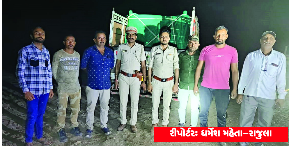
રીપોર્ટર: ધર્મેશ મહેતા-રાજુલા

રાજુલા, તા. ૧૪: રાજુલા વનવિભાગે મોટી ખેરાળી ગામ નજીક નેસડા વિસ્તારમાં એક ઈજાગ્રસ્ત સિંહનું રેસ્ક્યુ કરી સારવાર માટે ખસેડવામા આવ્યો હતો. દેશની શાન સમા એશિયાન્ટીક સિંહો એકમાત્ર ગુજરાતમાં જોવા મળી રહ્યા છે. ત્યારે સિંહો માટે વનવિભાગ હંમેશા ખડેપગે રહેતું આવ્યું છે. શેત્રુંજી કિવિઝનના રાજુલા રેન્જના મોટી ખેરાળી ગામે એક ઈજાગ્રસ્ત સિંહની જાણ વનવિભાગને થતાં ગઈકાલે મોડીરાતે વનવિભાગ દ્વારા સિંહને બચાવવા માટે રેસ્ક્યુ ઓપરેશન હાથ ધરવામાં આવ્યું હતું. અને જવલ્લે જ જોવા મળતી ઘટના