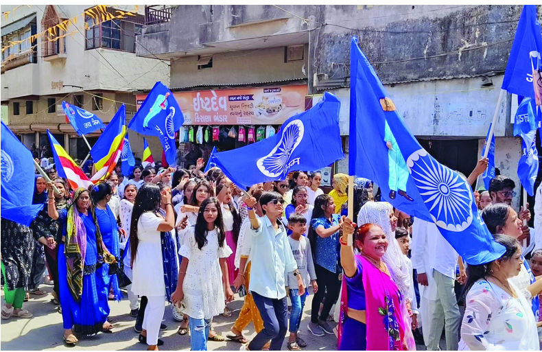
(સામના મિરર, સંવાદદાતા)

જેતપુર, તા. ૧૪: ભારતીય બંધારણના ઘડવૈયા ડો.બાબા સાહેબ આંબેડકરની ૧૩૩ મી જન્મ જયંતિ સમગ્ર દેશમાં ઉજવણી કરવામાં આવી રહી છે, દલિત સમાજના લોકો દ્વારા ઠેર ઠેર ઉજવણી કરવા માટે દિવસભર કાર્યક્રમ યોજવામાં આવ્યો હતા, ત્યારે જેતપુર શહેર અને ગ્રામ્ય વિસ્તારમાં ડો.બાબા સાહેબ આંબેડકર જન્મ જયંતિ ઉજવણી કરવામાં આવી હતી.