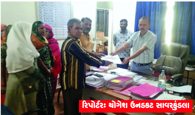
રિપોર્ટર: યોગેશ ઉનડકટ સાવરકુંડલા

(સામના મિરર, સંવાદદાતા) સાવરકુંડલા, તા. ૧૪: બગડા વાસ અમરેલી રોડ સાવરકુંડલાના રહેવાસી ને.સરકાર શ્રી દ્વારા ફાળવેલું સ્મશાન (કબસ્તાન) જે હાથસણી રોડ પર આવેલું છે. તેમાં અમુક ઈસમો દ્વારા અને રાજકારણી લોકોએ સ્મશાન ની અંદર ગેર કાયદેસર રીતે કબ્જો