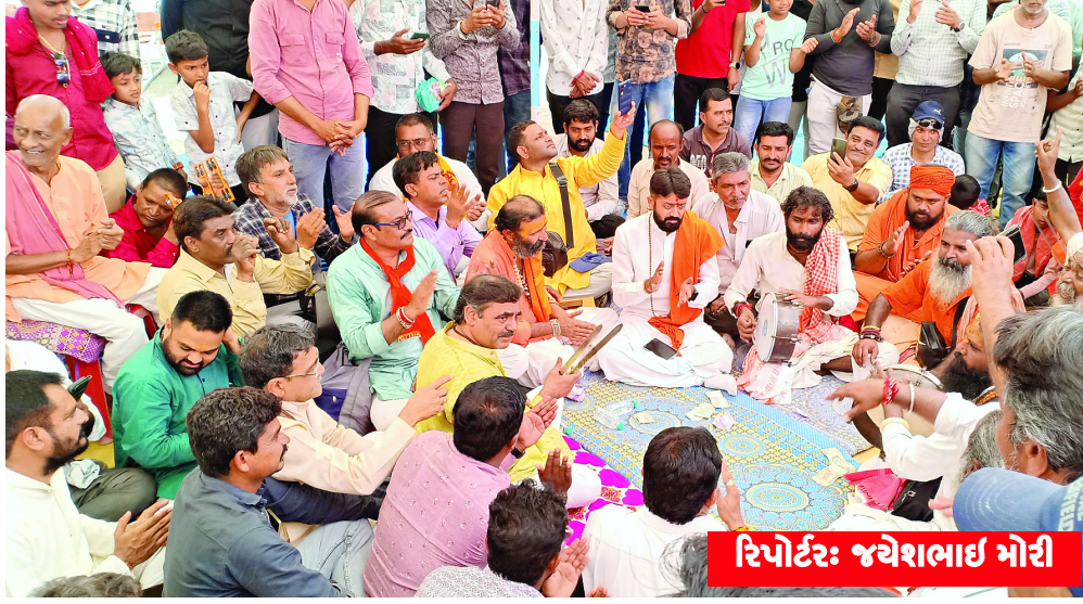
રિપોર્ટર: જયેશભાઈ મોરી

ચોટીલા, તા. ૧૪: ચોટીલા એ ભારત દેશનાં પશ્ચિમ ભાગમાં આવેલા ગુજરાત રાજ્યના સૌરાષ્ટ્ર વિસ્તારમાં આવેલા સુરેન્દ્રનગર જિલ્લામાં આવેલ મહત્વનું યાત્રાધામ છે. આ ઉપરાંત ચોટીલા તાલુકાનું મુખ્ય મથક પણ છે. ધર્મ જાગરણ સમન્વય આયોજિત ચોટીલા ડુંગર પરિક્રમા સમિતિ દ્વારા પ્લાસ્ટિક અને પ્રદૂષણ મુક્ત થીમ આધારિત આજે તા. ૧૪મી એપ્રિલના રવિવારે ચૈત્રી નવરાત્રી છટ્ટા નોરતે, તથા ડો.ભીમરાવ આંબેડકર જયંતિ ,ચોટીલા ડુંગર પરિક્રમાનું આયોજન કરાયું હતું. આ ધર્મોત્સવ અંતર્ગત સવારે ૮-૦૦ કલાકે નવગ્રહ મંદિર ખાતે સાધુ સંતો અને ધર્મ પ્રેમી આગેવાનો દ્વારા સભા બાદ ધ્વજા દંડની પૂજા બાદ પરિક્રમા યાત્રાનું પ્રસ્થાન કરાવાયું. ચોટીલા ડુંગર પરિક્રમા ૦૬ કિલોમીટરના ઝૂમાં ૬૨ ૮૦૦ મીટરના અંતરમાં પાણી, છાશ, શરબત તેમજ પરિક્રમાની પૂર્ણાહુતિ બાદ ચામુંડા ભોજનાલય મહાપ્રસાદનું આયોજન ૧૧