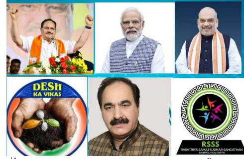
اپنے جامع ترقی اور پلک پیدا کرنے کے لیے پرعزم ہے۔ مثال کے طور پر، بھارتی کمزور کیونٹیر کے درمیان پلک پیدا کرنے کی حکومت کی کوششوں میں سب سے آگے رہے ہیں۔ بی بی سی کے ایڈووکیٹ ایم آئی زرگر پٹنوی نے ہندوستان کے خواتین کی قیادت

میں ترقی کا عہد کیا ہے۔ جن وین یوجنا میں بہل کی وجہ سے 28 کروڑ خواتین کو بھلی بار بینک کھاتوں تک رسائی حاصل ہوئی ہے، جب کہ تقریباً 31 کروڑ MUDRA قرض خواتین کو دیا گیا ہے۔ 1 کروڑ لکھ بچی دی سیلے ہی ہندوستان میں دیسی منظر نامے کو تبدیل کر رہے ہیں۔ پریس ریلیز میں پٹنوی گورنر راشٹریہ سماج سنگٹھن نے بی بی سی کے ایڈووکیٹ ایم آئی زرگر پٹنوی (عالمی سفارتی امن سفیر) نے کہا کہ وزیر اعظم نریندر مودی جی کی متحرک قیادت میں مرکزی حکومت نے تیز رفتار اقتصادی ترقی کی اسکیم کا آغاز کیا ہے اور اس کی ترقی کی رفتار کو فروغ دیا ہے۔ سب کو بااختیار بنانے کے لیے۔ پریس ریلیز کے اختتام پر قومی گورنر راشٹریہ سماج سنگٹھن نے بی بی سی کے ایڈووکیٹ ایم آئی زرگر پٹنوی نے اپنے تمام رضا کاروں، عہدیداروں، مختلف خواتین وگنڈ اور تنظیم کے بوجھ وگت سے پورے ہندوستان میں ووٹ اور حمایت کے لیے زور دیا۔