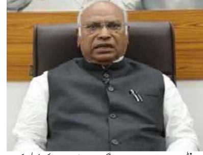
ایر ایٹس شپ کے حق سے ہڑ دگری، ڈی پلو مہ یافتگی بجلی نوکری لپی اور ایک سال میں ایک لاکھ روپے کا اعزاز دیا جائے گا۔

ایر ایٹس شپ کے حق سے ہڑ دگری، ڈی پلو مہ یافتگی بجلی نوکری لپی اور ایک سال میں ایک لاکھ روپے کا اعزاز دیا جائے گا۔ بیچ بیک سے آزادی دی جائے گی اور نوکری اختیارات کے لیے بیچ بیک ہونے کے معاملات کا پتلا کرنے کے لئے فاسٹ ٹریک کوش قائم کرنے کے متاثرین کو معاوضہ فراہم کیا جائے گا۔ کانگریس صدر نے کہا کہ "مگ کانوی کے لیے سہا سہا تحفظ کے لیے کانوی میں کام کرنے والے کارکنوں کے حقوق کے تحفظ کے لیے سہا سہا تحفظ کا قانون نافذ کریں گے۔ یو اورٹی کے تحت اسٹاٹس ایبس کے لیے فیڈرل آف فیڈرل ایگزیکیوٹو نوکری کے لیے اور دستیاب فنڈ کا 50 فیصد یعنی 000.5 کروڑ روپے جہاں تک ممکن ہو، ملک کے تمام اضلاع میں یکساں طور پر مختص کیے جائیں گے، تاکہ ملک بھر میں 40 سال سے کم عمر کے نوجوانوں کو اپنا کاروبار شروع کرنے کے لیے فنڈز فراہم کر لیا جائے، جس سے وہ اپنے کاروبار اور روزگار کو بڑھا سکیں اور روزگار کے مواقع پیدا کریں۔" انہوں نے کہا کہ "کانگریس سب میں نوجوانوں پر لگائی گئی آگنی ویرا کی بھر پور دہائی کے ساتھ ساتھ پانچ لاکھ نوکریوں کو دیکھ کر سب کے لیے تحریک کا ذریعہ: مودی۔