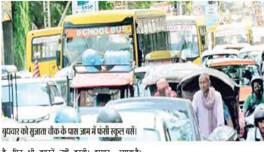
युधवार को सुजाता चौक के पास जाम में फंसी स्कूल बसें।

मेन रोड सहित सभी प्रमुख सड़कों में फुटपाथ पर दुकानदारों का कब्जा है। निगम और ट्रैफिक पुलिस रोजाना अभियान चलाती