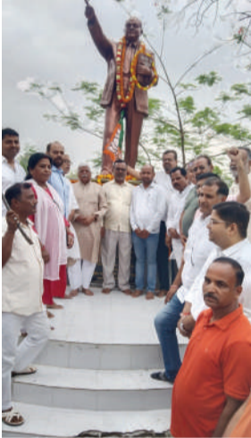
अम्बेडकर की प्रतिमा पर माल्यार्पण

डा. भीमराव आंबेडकर की जयंती भाजपा कार्यकर्ताओं ने समरसता दिवस के रूप में मनाया। मेदिनीनगर के अंबेडकर पार्क में संविधान निर्माता के प्रतिमा पर माल्यार्पण कर उन्हें याद किया।भारतीय जनता पार्टी द्वारा संविधान निर्माता भारत रत्न डॉ.भीमराव अंबेडकर की 133 वीं जयन्ती को समरसता दिवस के रूप में मनाया। इस अवसर पर पार्टी ने विभिन्न बृह स्तर पर कार्यक्रम किए। मेदिनीनगर के वार्ड 24 स्थित अम्बेडकर पार्क पर भाजपा पदाधिकारियों व कार्यकर्ताओं ने उपस्थित होकर डॉ.भीमराव