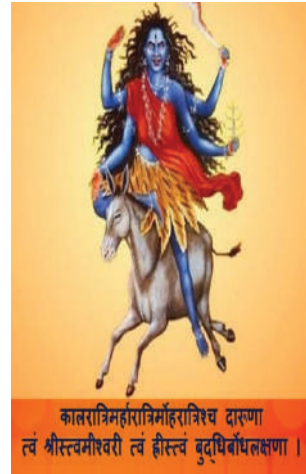
कातरामिहरासिंहराविक धारणा वं श्रीरविवीरवतं वं ह्रीरुतं वृद्धिपिठरुषणा ।

राष्ट्र, राष्ट्रहित और राष्ट्रवाद को सदैव समर्पित : देश से बढ़ कर कुछ भी नहीं !