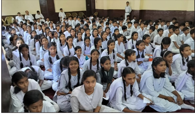
पोलिट लाइव रिपोर्टर

सिंदरी: सरस्वती विधा मंदिर सिंदरी के बाल सांसद निर्वाचन 2024-25 का शिशु भारती, बल भारती, कन्या भारती, के सदस्यों का परिणाम घोषित किया गया, चुने हुए सदस्य को एक कार्यक्रम