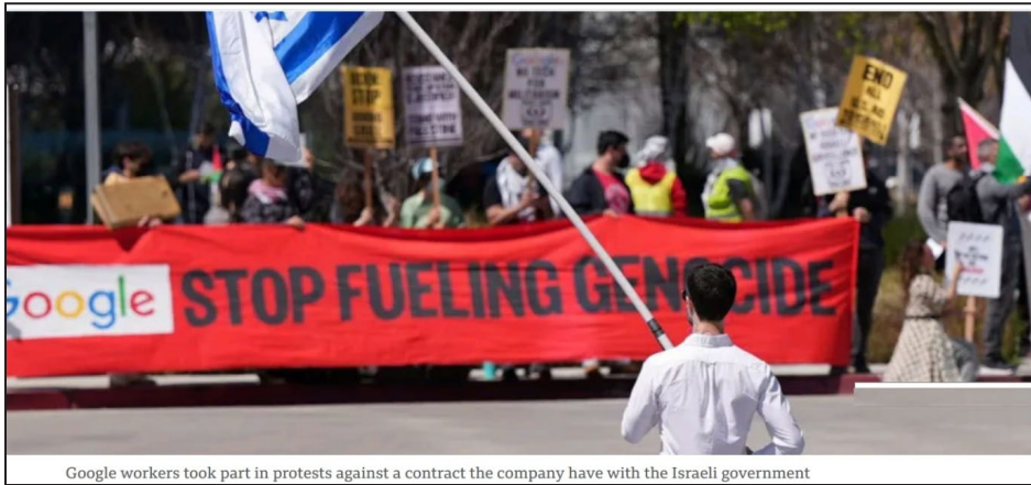
Google workers took part in protests against a contract the company have with the Israeli government

कर्मचारियों से न्याय की उम्मीद नहीं की जा सकती। इसलिए, कुछ महीने पहले सनातन संस्था के धार्मिक पूजा, आरती, नामजप और जागरूकता से संबंधित पांच ऐप को गूगल प्ले-स्टोर से हटा दिया गया था। इसके पीछे 'गाजा' फेम साम्यवादी मानसिकता के होने की संभावना को नकारा नहीं जा सकता। इसलिए सनातन संस्था