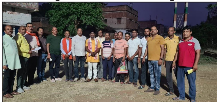
पोलिट लाइव रिपोर्टर