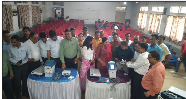
पोलिट लाइव रिपोर्टर

ईवीएम के ट्रबल शूटिंग पर दिया विशेष प्रशिक्षण