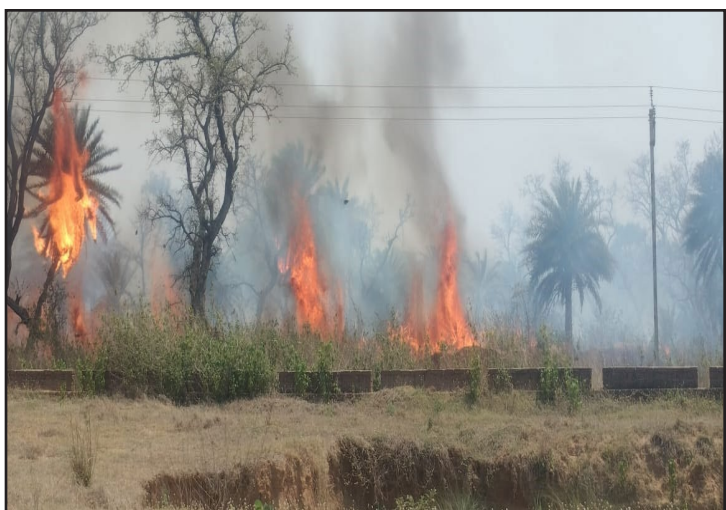
पोलिट लाइव रिपोर्टर

बलियापुर : बाघमारा गाँव के पास शिवपुर जाने वाली सड़क के अगल-बगल झाड़ जंगलों में असामाजिक तत्वों द्वारा गुरुवार को आग लगा दिए जाने से आग की लपटे तेजी से फैलने लगीं। दुर्घटना की आशंका को देख इसकी सूचना लोगों ने अग्निशमन विभाग सिंदरी को दी। सूचना पाकर विभाग का एक