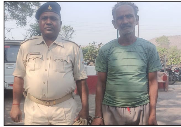
पोलिट लाइव रिपोर्टर

अवैध महुआ 19 लीटर शराब के साथ तिसरा पुलिस ने एक को धर दबोचा और जेल भेज दिया