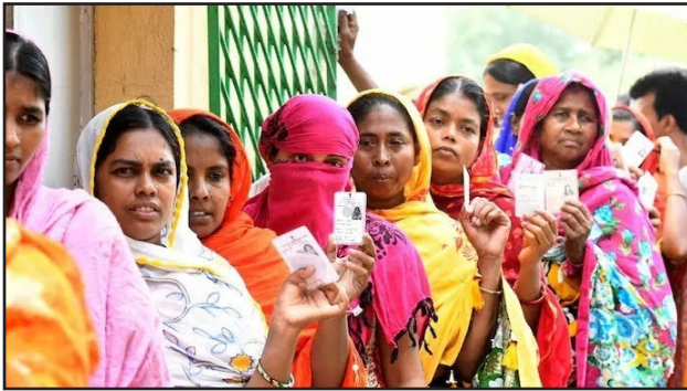
पोलिट लाइव रिपोर्टर

PL न्यूज डेस्क नयी दिल्ली : आम चुनाव के पहले चरण में 21 राज्यों और केंद्र शासित प्रदेशों (यूटी) में 102 संसदीय सीटों के लिए शुक्रवार सुबह सात बजे मतदान शुरू होगा। जिसके लिए चुनाव अधिकारी मतदान केन्द्रों पर पहुंचा दिये गये हैं। पहले चरण में लोक सभा के साथ साथ अरुणाचल प्रदेश और सिक्किम विधानसभा कुल 92 सीटों के लिए भी मतदान कराये जाएंगे।