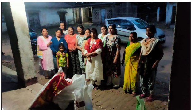
पोलिट लाइव रिपोर्ट