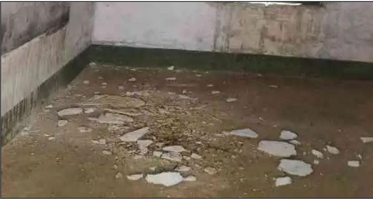
पोलिट लाइव रिपोर्ट

कतरास : उत्कर्मित उच्च विद्यालय नगरीकला में सोमवार को कक्षा दो की छत का प्लास्टर अचानक भरभरा कर गिर गया। इस घटना में कक्षा में पढ़ रहे