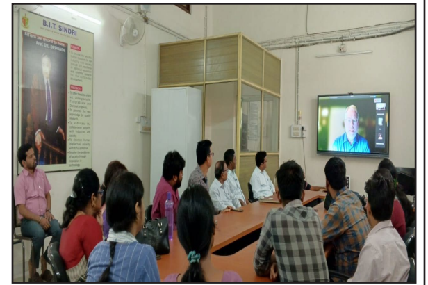
पोलिट लाइव रिपोर्ट

सिंदरी: बीआईटी सिंदरी के विद्युत विभाग में सोमवार को एक दिवसीय आनलाइन सेमिनार का आयोजन किया गया। इस सेमिनार का मुख्य विषय था सरकार के साथ काम करने का कैसे और क्यों, जिसपर उपस्थित लोगों ने विस्तार पूर्वक चर्चा की गई।