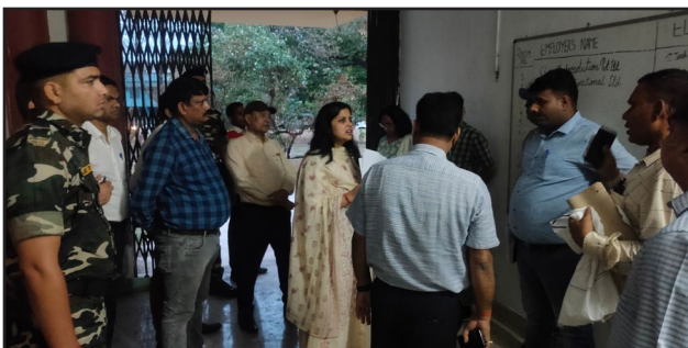
पोलिट लाइव रिपोर्ट