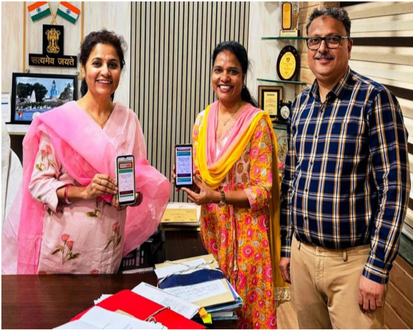
करने के निर्देश प्रदान किए गए हैं। मतदाताओं को जागरूक करने के साथ ही नवाचारों के माध्यम से मतदाताओं को जागरूक करने के प्रयास भी किए जा रहे हैं।