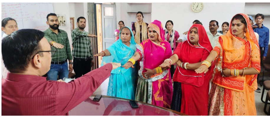
प्रेरित किया गया। इसके तहत सभी विद्यालयों में मतदाता जागरूकता गतिविधियां की जा रही हैं और बच्चे प्रेरित होकर आमजन को मतदान के लिए प्रेरित कर रहे हैं।