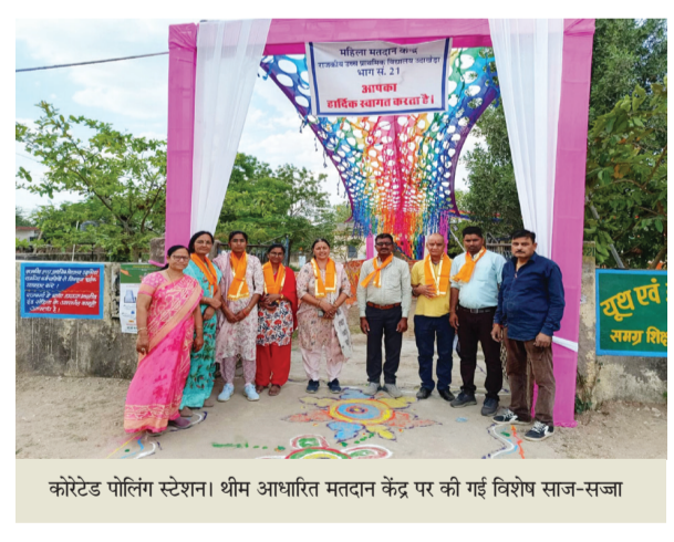
कोरेटड पोलिंग स्टेशन। थीम आधारित मतदान केंद्र पर की गई विशेष साज-सज्जा

उदयपुर शहर में ग्रीन एवं पिंक थीम आधारित मतदान केंद्रों में आरएमवी शिक्षक प्रशिक्षक महाविद्यालय तथा राजकीय बालिका उच्च माध्यमिक विद्यालय जगदीश चौक शामिल है। इसी प्रकार ग्रामीण विधानसभा क्षेत्र में राजकीय उच्च माध्यमिक विद्यालय बलीचा एवं राजकीय वरिष्ठ उपाध्याय संस्कृत उच्च माध्यमिक विद्यालय सवीना शामिल है। वहीं उदयपुर विकास प्राधिकरण ने भी शहर में विद्या भवन कॉलेज साइफन चौराहा, रियान इंटरनेशनल स्कूल सेक्टर 14 एवं जवाहर नगर स्थित साधु भवन मतदान केंद्रों पर विशेष साज-सज्जा की है।