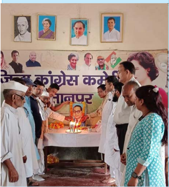
दैनिक लोकजन संदेश