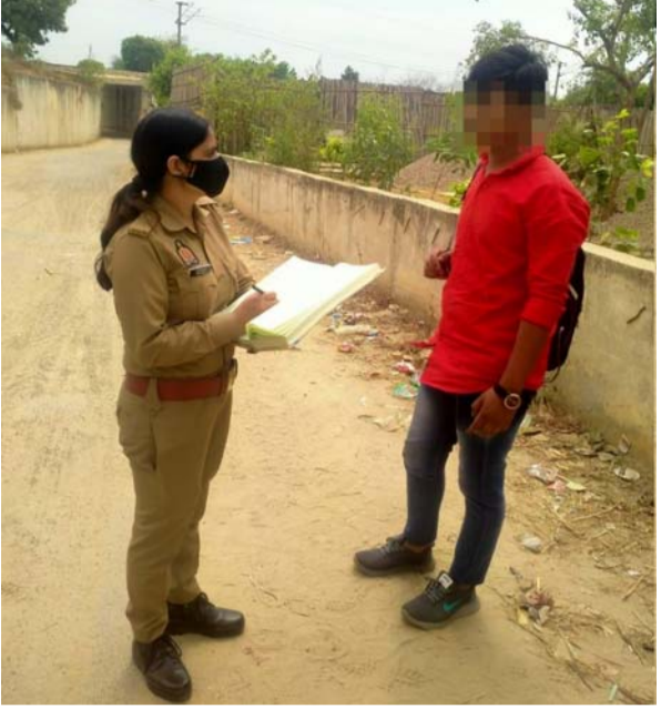
हापुड़ संवाददाता लोकजन संदेश