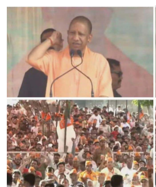
करोड़ का भारत) के बीच है। सपा-बसपा और कांग्रेस के लोग अपने परिवार के बाहर सोच भी नहीं सकते। अब सुरक्षा-निवेश का बेहतर माहौल है

बोले कि उग्र में कोई बीमार हो गया। उसके पास आयुष्मान कार्ड नहीं है। सांसद-विधायक व पीड़ित ने पत्र लिख दिया तो सीधे अकाउंट में पैसा भेज दिया जाता है। बीमारी के कारण परिवार पर कोई आर्थिक बोझ न आए, सरकार इसका दायित्व और उपचार का खर्च वहन करने की जिम्मेदारी लेती है। सीएम ने कहा कि नोएडा, ग्रेनो व यमुना अथॉरिटी में बिल्डर-बायर्स की समस्याओं का निदान कराकर वर्षों से लंबित मामले समाप्त कराते हुए बायर्स को हक दिया जा रहा है। ,सीएम ने कहा कि पहले देश हित नहीं, बल्कि परिवार के बारे में सोचने वाले लोग थे। यह चुनाव स्वार्थ के परिवार बनाम मोदी के परिवार (140