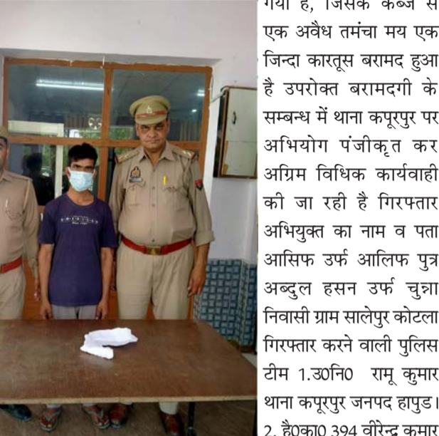
हापड़ संवाददाता लोकजन संदेश हापड़ पुलिस द्वारा जनपद में अपराध की रोकथाम एवं वांछित अभियुक्तों की गिरफ्तारी हेतु चलाए जा रहे अभियान के अन्तर्गत थाना कपूरपुर पुलिस द्वारा थाने के भादवि व 07 सीएलए एकट में वांछित चल रहे एक अभियुक्त को सालपुर नहर पुलिया के पास से गिरफ्तार किया थाना कपूरपुर जनपद हापड़