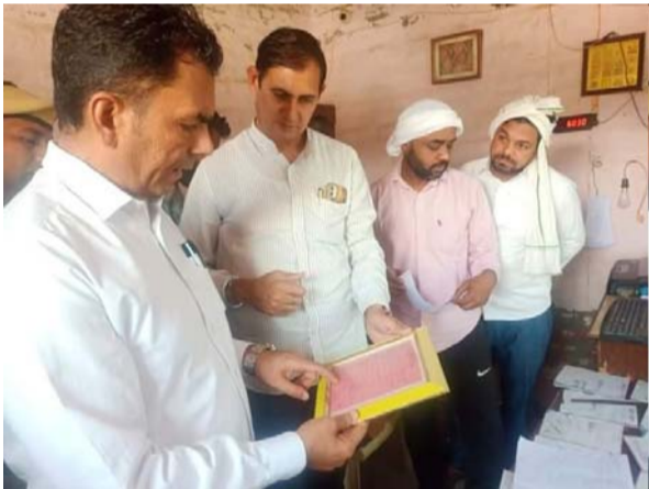
(लोकजन संदेश/सुमित गर्ग) जौंद, उचाना के एसडीएम गुलजार मलिक ने सोमवार को उचाना अनाज मंडी का दौरा कर फसल खरीद को लेकर की गई व्यवस्थाओं का बारीकी से निरीक्षण किया और संबंधित अधिकारियों से कहा कि किसानों को फसल बिक्री के दौरान मंडियों में कोई परेशानी नही होनी चाहिए। उठान कार्य में संबंधित ठेकेदार अपनी रुचि बनाए रखें, इस कार्य में किसी भी प्रकार की कोताही सहन नहीं की जाएगी और ठेकेदार

करते रहे ताकि किसान मंडियों में अपनी फसल सहजता से उतार सकें। अब मंडियों में गेहूं की आवक जोरों पर है, इसलिए पर्याप्त व्यवस्थाएं पूर्ण रखें। गामों के मौसम के मध्य नजर पर्याप्त स्वच्छ पेयजल उपलब्ध करवाने के लिए वाटर कुलरो को व्यवस्था मंडियों में की गई है। अगर पानी की कमी नजर आए तो तुरंत अतिरिक्त व्यवस्था करवाएं। उन्होंने किसानों से भी आग्रह किया है कि वे फसलों को सुखाकर मंडियों में लाएं ताकि फसल खरीद का कार्य तुरंत हो सके। उन्होंने कहा कि मंडियों में बिजली, पानी, बारदाने इत्यादि की समुचित व्यवस्था करके रखें। सम्बंधित अधिकारियों ने बताया कि फसल खरीद को लेकर तमाम तैयारियां पूर्ण की जा चुकी हैं और मंडियों में गेहूं की आवक भी जोरों पर है। फसल खरीद में किसी प्रकार की कोई परेशानी आडे नहीं आ रही है। एसडीएम ने मार्केट कमेटी के अधिकारियों को स्पष्ट कहा कि अगर उन्हें फसल खरीद के कार्य में कोई भी अड़चन आ रही है तो तुरंत सूचित करें। हर समस्या का समाधान तुरंत करवाया जाएगा ताकि किसानों को कोई परेशानी न हो। इस अवसर पर विभिन्न विभागों के अधिकारी एवं कर्मचारी मौजूद रहे। इसके तत्पश्चात उचाना के एसडीएम गुलजार मलिक ने उचाना में स्थापित सभी धर्म कांटों का निरीक्षण किया और उन सभी धर्म कांटों पर स्वयं एसडीएम ने अपनी गाड़ी का वजन करवाया और सभी गाड़ियों में धर्मकांटों पर गाड़ी का वजन बराबर पाया गया। एसडीएम ने मौके पर ही सभी धर्मकांटों के प्रमाण-पत्र भी चैक किये गए जो सही पाए गए। इस अवसर पर मार्केट कमेटी के सचिव संदीप कुमार, पूर्व प्रधान दाड़न खाप दलबीर सिंह, मंडी एसोसिएशन प्रधान सत्यवान, हरदीप डूबरखा व लाला रामनिवास करसिन्धु सहित अन्य मौजिज व्यक्ति मौजूद रहे।