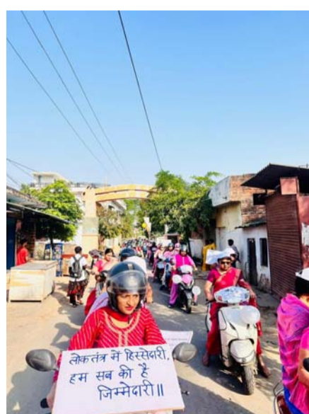
दैनिक लोकजन संदेश सुल्तानपुर जिला निर्वाचन अधिकारी के कुशल निर्देशन में लोकसभा सामान्य निर्वाचन-2024 में मतदान प्रतिशत बढ़ाने हेतु स्वीप योजनान्तर्गत