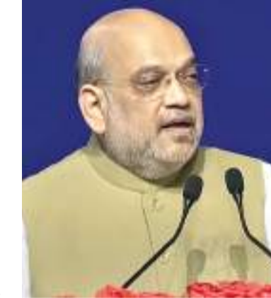
छत्तीसगढ़ के कांकर में मंगलवार को नक्सलियों से मुठभेड़ में सुरक्षाबलों को बड़ी कामयाबी मिली, इनामी नक्सली कमांडर सहित 29 नक्सली मारे गए थे

एजेन्सी नई दिल्ली। केंद्रीय गृह मंत्री अमित शाह ने बुधवार को छत्तीसगढ़ में नक्सलियों के खिलाफ मिली सफलता को केन्द्र और राज्य में भाजपा सरकार को गति मिली है। नक्सली इलाकों में सुरक्षा बल कैम्प लगाए जा रहे हैं। 19 के बाद इनकी संख्या 250 हो गई है। नक्सलियों के खिलाफ चलाए जा रहे अभियान में छत्तीसगढ़ पुलिस से भी मदद मिल रही है। उन्होंने कहा कि राज्य में भाजपा सरकार बनने के बाद तीन महीने में 80 से ज्यादा नक्सली मारे गए हैं। 125 गिरफ्तार हुए हैं और 150 ने आत्मसमर्पण किया है। आगे भी इस तरह के अभियान जारी रहेंगे। बहुत कम समय में मोदी के नेतृत्व में देश से नक्सलवाद को उखाड़ फेंकेंगे।