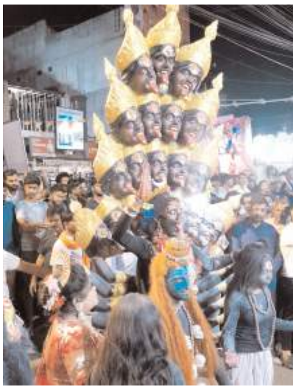
मां काली की सजीव झांकी शोभा यात्रा में रही आकर्षण का केंद्र

रांची। राजधानी में रामनवमी के मौके पर कौमी एकता की मिशाल देखने को मिली जहां मुस्लिम समाज के लोगों ने दिल्ल खोलकर रामनवमी की शोभा यात्रा का स्वागत किया। इसमें धौताल अखाड़ा, डेली मार्केट दुकानदार एसोसिएशन के अलावा कई अन्य संगठन के सदस्य शामिल थे।