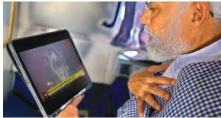
तिलक, विकसित भारत के हर संकल्प को अपनी दिव्य ऊर्जा से इसी तरह प्रकाशित करेगा।

नयी दिल्ली। प्रधानमंत्री नरेन्द्र मोदी ने बुधवार को भगवान श्रीराम के उनके भव्य मंदिर में हुए सूर्य तिलक का प्रसारण अपने टैब पर देखा। उन्होंने इसे बेहद ही भावुक क्षण बताया। यह दृश्य देखने से पूर्व ही उन्होंने विमान में भी अपनी चपलें उतारी हुई थी। प्रधानमंत्री ने असम के नलबाड़ी में एक जनसभा को संबोधित करने के बाद अयोध्या में हुए सूर्य तिलक का प्रसारण देखा। इस संबंध में उन्होंने फोटो साझा करते हुए एक्स पर कहा, नलबाड़ी की सभा के बाद मुझे अयोध्या में रामलला के सूर्य तिलक के अद्भुत और अप्रतिम क्षण को देखने का सौभाग्य मिला। श्रीराम जन्मभूमि का ये बहुप्रतीक्षित क्षण हर किसी के लिए परमानंद का क्षण है। ये सूर्य