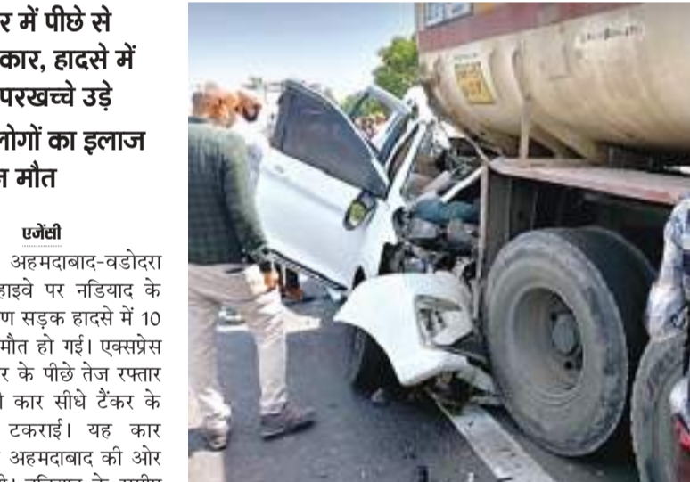
हाइवे के समीप थे, इसी दौरान जोरदार आवाज सुनकर सभी घटनास्थल पर पहुंच गए। यहां एक टैकर के पीछे कार अंदर जा चुसी थी। क्रैन बुलाकर किसी तरह कार को बाहर निकाला गया। कार से 10 लोगों को बाहर निकाला गया। इसमें 8 लोगों की घटनास्थल पर ही मौत हो गई थी। बाकी दो लोगों को हॉस्पिटल ले जाया गया, जहां इलाज के दौरान दोनों की मौत हो गई। पुलिस मृतकों की पहचान के लिए उनके पास से मिले आधार कार्ड के जरिए जांच कर रही है।

दो लोगों का इलाज के दौरान मौत एजेन्सी नडियाद। अहमदाबाद-वडोदरा एक्सप्रेस हाइवे पर नडियाद के समीप भीषण सड़क हादसे में 10 लोगों की मौत हो गई। एक्सप्रेस वे पर टैकर के पीछे तेज रफ्तार में आ रही कार सीधे टैकर के पीछे जा टकराई। यह कार वडोदरा से अहमदाबाद की ओर जा रही थी। नडियाद के समीप अपने से आगे जा रहे टैकर से कार तेज रफ्तार में जा टकराई। इसके बाद पूरा हाइवे चीख-पुकार से गूंज उठा। घटना की जानकारी मिलते ही स्थानीय पुलिस समेत फायर ब्रिगेड की गाड़ियां मौके पर पहुंच गईं। प्रत्यक्षदर्शियों के अनुसार वे