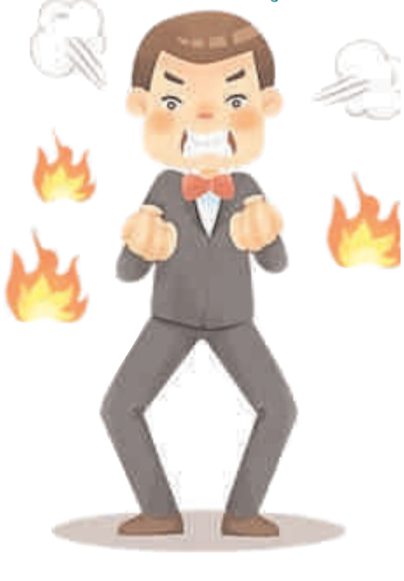
गुस्सा कम करने के उपाय...

गुस्सा आना सामान्य बात है। लेकिन, यदि आपको हर छोटी-छोटी बात पर गुस्सा आ जाता है, तो यह चिन्ता की बात है। यह आपके लिए घातक सिद्ध हो सकता है, क्योंकि जब गुस्सा आता है, तो कई बार हमें ध्यान नहीं रहता है कि हम कहां खड़े हैं और किससे बात कर रहे हैं। गुस्सा हमारे सम्बन्ध खराब कर देता है...बना-बनाया काम बिगाड़ देता है। यदि आप आसान टिक से अपने गुस्से पर काबू पाना चाहते हैं, तो आपको कुछ उपाय करने पड़ेंगे। आइए...बताते हैं, गुस्सा कम करने के उपायों के बारे में...।