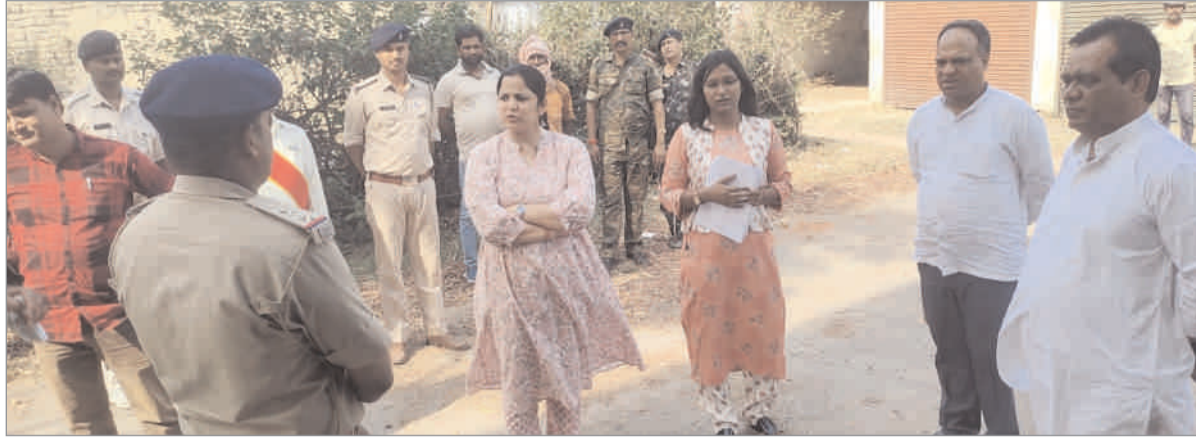
पीने योग्य पानी, शौचालय, बिजली, रैप, शेड आदि की

बूथ नंबर 280 एवं 268 का निरीक्षण कर एएमएफ की व्यवस्था का जायजा लिया। निरीक्षण के दौरान जिला निर्वाचन पदाधिकारी ने जिन-जिन बूथ में एएमएफ की व्यवस्था में कमी नजर आई वैसे बूथों के पदाधिकारी को ससमय