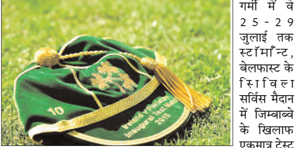
गर्मी में वे 25 - 29 जुलाई तक स्टॉर्मॉन्ट, बेलफास्ट के स्थिति में आयरलैंड में जिम्बाब्वे के खिलाफ एकमात्र टेस्ट मैच में जुलाई में तीन एकदिवसीय और तीन टी20 के लिए आयरलैंड का दौरा करना था, लेकिन इसके बजाय वे सितंबर के अंत से अबू धाबी में तीन एकदिवसीय और दो टी20 खेलेंगे। यह आयरलैंड के खिलाफ लगातार दूसरी विदेशी

नई दिल्ली : आयरलैंड इस साल के अंत में अबू धाबी में दक्षिण अफ्रीका के खिलाफ एक 'घरेलू' सफेद गेंद श्रृंखला का आयोजन करेगा, इसके बाद जुलाई में अपने इतिहास में दूसरी बार घरेलू पुरुष टेस्ट मैच की भी मेजबानी करेगा, जब उनकी टीम स्टॉर्मॉन्ट में जिम्बाब्वे के खिलाफ खेलेगी। क्रिकेट आयरलैंड ने सोमवार को पुरुष और महिला टीमों के लिए अपने घरेलू कार्यक्रम की घोषणा की है, हालांकि सभी मैच घर पर नहीं होंगे। आयरलैंड ने 2017 में पूर्ण सदस्य का दर्जा प्राप्त किया और 2018 में डबलिन के पास मालाहाइड में अपना पहला पुरुष टेस्ट मैच खेला, लेकिन उनके