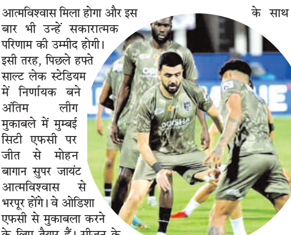
आत्मविश्वास मिला होगा और इस बार भी उन्हें सकारात्मक परिणाम की उम्मीद होगी। इसी तरह, पिछले हफ्ते साल्ट लेक स्टेडियम में निर्णायक बने अंतिम लीग मुकाबले में मुम्बई सिटी एफसी पर जीत से मोहन बागान सुपर जायंट आत्मविश्वास से भरपूर होगा। वे ओडिशा एफसी से मुकाबला करने के लिए तैयार हैं। सीजन के एक बड़े हिस्से के दौरान, ओडिशा एफसी तालिका में शीर्ष दो स्थानों की दौड़ में थी। हालांकि, वो कुछ खराब नतीजों के कारण 39 अंकों के साथ

भुवनेश्वर : ओडिशा एफसी और मोहन बागान सुपर जायंट आज शाम यहां कलिंगा स्टेडियम में इंडियन सुपर लीग (आईएसएल) 2023-24 में पहले सेमीफाइनल के पहले चरण के मुकाबले में भिड़ेंगे। मोहन बागान ने अंक तालिका में शीर्ष पर रहते हुए आईएसएल 2023-24 लीग विनर्स बनकर सेमीफाइनल के लिए क्वालीफाई किया। दूसरी ओर, ओडिशा एफसी ने प्लेऑफ में केरला ब्लास्टर्स एफसी को हराकर सेमीफाइनल में जगह बनाई। ये दोनों टीमों इस सीजन के दौरान आईएसएल और एफसी कप में कई बार आमने-सामने हो चुकी हैं। ओडिशा को पिछले मैच में येलो कार्मी के खिलाफ घर पर जीत से