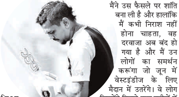
नरेन ने सोमवार देर रात इंस्टाग्राम पर लिखा, मैं वास्तव में बहुत खुश हूँ और आभारी हूँ कि हाल ही में मेरे प्रदर्शन ने कई लोगों को सार्वजनिक रूप से मेरे संन्यास से वापस आने और आगामी टी20 विश्व कप में खेलने की इच्छा व्यक्त करने के लिए प्रेरित किया है। मैंने उस फैसले पर शांति बना ली है और हालांकि मैं कभी निराश नहीं होना चाहता, वह दरवाजा अब बंद हो गया है और मैं उन लोगों का समर्थन करूंगा जो जून में वेस्टइंडीज के लिए मैदान में उतरेंगे। वे लोग जिन्होंने पिछले कुछ महीनों में कड़ी मेहनत की है और हमारे अद्भुत प्रशंसकों को यह दिखाने के लायक हैं कि वे एक और खिताब जीतने में सक्षम हैं - मैं आपको शुभकामनाएं देता हूँ।

2023 में अंतरराष्ट्रीय क्रिकेट से संन्यास ले लिया, 2019 के बाद से वेस्टइंडीज के