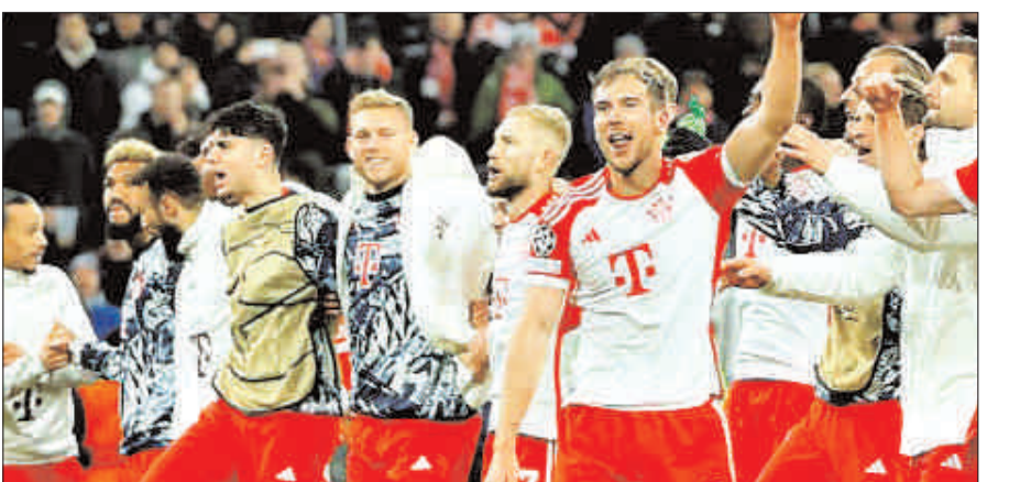
सफलता नहीं मिली और पहला हॉफ गोल रहित समाप्त हुआ। बायर्न ने दूसरे हाफ में जोरदार शुरुआत की। लियोन गोरेत्जका ने हेडर के जरिये गोल करने की कोशिश की, लेकिन उनका शॉट गोलपोस्ट से टकरा कर वापस आया, जिसपर राफेल

एजेंसी बर्लिन। जोशुआ किमिच के एकमात्र गोल की मदद से बायर्न म्युनिख ने बुधवार को दूसरे चरण में आर्सेनल को 1-0 (कुल मिलाकर 3-2) से हराकर यूईएफए चैंपियंस लीग के अंतिम चार में प्रवेश किया। बायर्न म्युनिख ने फरेल दर्शकों के सामने शानदार शुरुआत की। मैच के शुरुआती मिनट में हैरी केन गोल करने के बेहद करीब थे, लेकिन उनका शॉट गोलपोस्ट से चूक गया। इसके बाद दोनों टीमों ने बेहतर खेल का प्रदर्शन करते हुए गोल करने के कई मौके बनाए, लेकिन