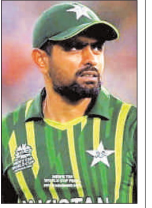
3698 रनों के साथ ही तीसरे नंबर पर हैं। विराट को पीछे छोड़ने के लिए बाबर आजम को 340 रन की जरूरत है। ऐसे में कीवी टीम के खिलाफ आजम के पास विराट के महारिकार्ड को तोड़ने का अच्छा मौका है।

एजेंसी लाहौर। पाकिस्तान टीम की कप्तान दोबारा संभालने वाले बाबर आजम न्यूजीलैंड के खिलाफ 5 मैचों की सीरीज में टी20 अंतरराष्ट्रीय में सबसे ज्यादा रन बनाने वाले बल्लेबाजों की सूची में भारत के रोहित शर्मा और विराट कोहली को भी पीछे छोड़ सकते हैं। इस प्रकार वह बतौर कप्तान सबसे ज्यादा रन बनाने वाले बल्लेबाज बन जाएंगे। अभी तक टी20 अंतरराष्ट्रीय क्रिकेट में सर्वाधिक रन बनाने का विश्व कीर्तिमान विराट के नाम है। विराट ने 117 टी20 मैचों में 4037 रन बनाए हैं। इस सूची में दूसरे नंबर पर टीम इंडिया के कप्तान रोहित हैं। रोहित ने 151 टी20 अंतरराष्ट्रीय मैचों में 3974 रन बनाए हैं। वहीं आजम