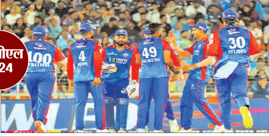
अंक तालिका में भी बदलाव आया है और अंक तालिका में दिल्ली दो पायदान ऊपर आकर

एजेंसी नयी दिल्ली। आईपीएल 2024 के एक अहम मुकाबले में दिल्ली कैपिटल्स ने गुजरात टाइटंस को छह विकेट से हरा दिया। इस मैच में गुजरात टाइटंस की टीम केवल 89 रन पर ही आउट हो गयी। इसके बाद जीत के लिए मिले 90 रनों के लक्ष्य को दिल्ली ने चार विकेट के नुकसान पर ही हासिल कर लिया। दिल्ली को ओर से जेक फ्रेजर मैकगर्क ने सबसे ज्यादा 20 रन बनाए। दिल्ली की इस बड़ी जीत के बाद