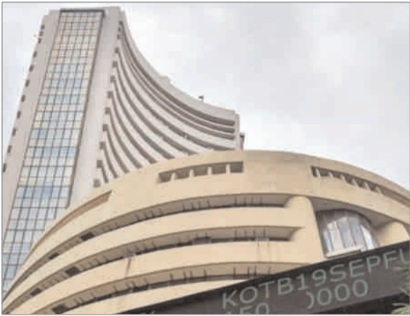
इंडस्ट्रीज का बाजार पूंजीकरण 10,250.02 करोड़ रुपये बढ़कर 19,85,797.70 करोड़ रुपये, टाटा कंसल्टेंसी सर्विसेज (टीसीएस) का मूल्यांकन 7,507.53 करोड़ रुपये के उछाल के साथ

मुंबई (ईएमएस) : पिछले सप्ताह सेंसेक्स की प्रमुख 10 में से सात कंपनियों के बाजार पूंजीकरण (मार्केट कैप) में 59,404.85 करोड़ रुपये की बढ़ोतरी हुई है। इसमें सबसे अधिक मुनाफा भारतीय एयरटेल और आईसीआईसीआई बैंक को हुआ। समीक्षाधीन सप्ताह में भारतीय एयरटेल का बाजार पूंजीकरण 19,029.37 करोड़ रुपये बढ़कर 6,92,861.27 करोड़ रुपये, आईसीआईसीआई बैंक का बाजार पूंजीकरण 15,363.23 करोड़ रुपये बढ़कर 7,75,447.63 करोड़ रुपये, रिलायंस