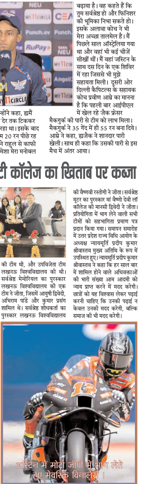
अरिस्टन में मोटो जीपी में भाग लें और मेवरिक विनालैस।