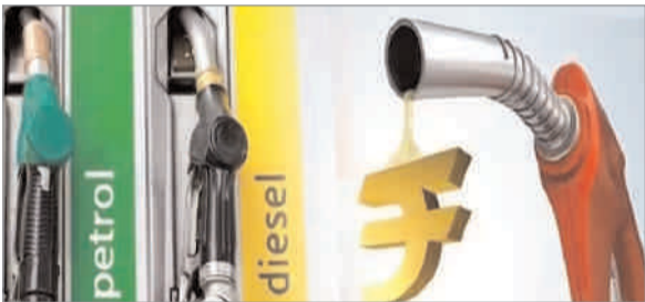
गिरावट है। केरल, गोवा और ओडिशा में भी पेट्रोल-डीजल के भाव गिरे हैं। दिल्ली में पेट्रोल 94.72 रुपये और डीजल 87.62 रुपये प्रति लीटर, मुंबई में पेट्रोल 104.21 रुपये और डीजल 92.15 रुपये प्रति लीटर, कर्नातका में पेट्रोल 103.94 रुपये और डीजल 90.76 रुपये प्रति लीटर, चेन्नई में पेट्रोल 100.75 रुपये और डीजल 94.34 रुपये प्रति लीटर, ओएंडा में

नयी दिल्ली (ईएमएस) : वैश्विक बाजारों में कच्चे तेल की कीमतों में कोई बदलाव नहीं हुआ है। डब्ल्यूटीआई क्रूड 85.66 डॉलर प्रति बैरल पर बिक रहा है। वहीं ब्रेट क्रूड 90.45 डॉलर प्रति बैरल पर कारोबार कर रहा है। भारत में हर सुबह 6 बजे इंधन के दामों में संशोधन किया जाता है। हरियाणा में रविवार को पेट्रोल की कीमत में 30 पैसे और डीजल में 29 पैसे की तोजी आई है। पंजाब में पेट्रोल 30 पैसे और डीजल 34 पैसे महंगा हो गया है। पश्चिम बंगाल, तमिलनाडु, कर्नाटक और गुजरात में पेट्रोल-डीजल की कीमत में तेजी देखने को मिल रही है। दूसरी ओर राजस्थान में पेट्रोल 39 पैसे और डीजल 34 पैसे सस्ता हो गया है। महाराष्ट्र में भी पेट्रोल-डीजल की कीमत में 10 पैसे से ज्यादा की