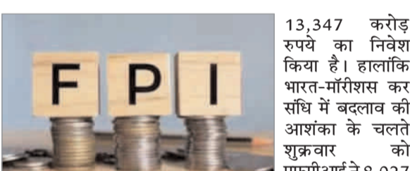
में एफपीआई के निवेश पर देखने को मिल सकता है। उन्होंने कहा कि घरेलू संस्थागत निवेशक (डीआईआई) के पास काफी निवेशक तथा उच्च संपदा वाले व्यक्ति यानी एचएनआई भारतीय बाजार को लेकर आशाश्वित हैं। ऐसे में एफपीआई की बिकवाली की भरपाई यहां से हो जाएगी। डिपॉजिटरी के आंकड़ों के मुताबिक एफपीआई ने इस महीने 12 अप्रैल तक भारतीय शेयरों में

नयी दिल्ली (ईएमएस) : बाजार के जानकारों ने कहा कि घरेलू अर्थव्यवस्था की मजबूत स्थिति तथा आर्थिक वृद्धि की बेहतर संभावनाओं के चलते विदेशी पोर्टफोलियो निवेशकों (एफपीआई) ने अप्रैल के पहले दो सप्ताह में भारतीय शेयर बाजारों में 13,300 करोड़ रुपये से अधिक का निवेश किया है। बाजार विशेषज्ञों ने कहा कि आगे चलकर भारत-मॉरीशस कर संधि में बदलावों पर चिंता एफपीआई प्रवाह पर असर डालेगी। यह स्थिति नई संधि के विवरण पर स्पष्टता आने तक बनी रह सकती है। उन्होंने कहा कि एक और बड़ी चिंता पश्चिम एशिया में बढ़ता तनाव है। ईरान-इजराइल के बीच तनाव बढ़ रहा है जिसका असर निकट अवधि