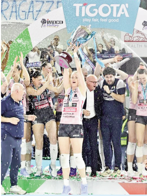
इटली में कोनेजिलियानो टीम के सदस्य सीरीज 1 महिला वालीबाल लीग में जीत के बाद ट्रॉफी के साथ नजर आये।