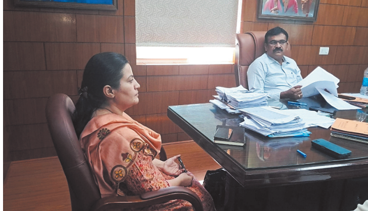
दूसरी ओर बैठक में शामिल गृह विभाग पदाधिकारी ने कहा कि वे विभिन्न सिक्कुरिटी के अधिकारियों से मुख्य निर्वाचन एजेंसियों से संपर्क कर उसमें कार्यरत कर्मियों

श्रम विभाग की ओर से बैठक में बताया गया कि उनके पास 1 लाख 70 हजार प्रवासी मजदूरों का डेटा है। उनके मोबाइल नंबर भी हैं। मुख्य निर्वाचन पदाधिकारी ने कहा कि प्रवासी मजदूरों को उनके मोबाइल नंबर पर बल्क मैसेज भेजकर उनसे चुनाव महापर्व में भागीदारी करने और मतदान के लिए प्रेरित किया जाएगा।