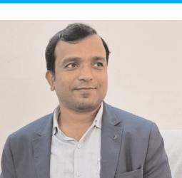
लिस्ट कटने के बाद उन्हें अपने वाहनों को 15 मई को विनोबा भावे में जमा करना पड़ेगा और 15 मई से ही गाड़ी बुक भी हो जाएगी। इस दौरान निर्धारित दर पर पैसे का भुगतान वाहन मालिकों के खाते में