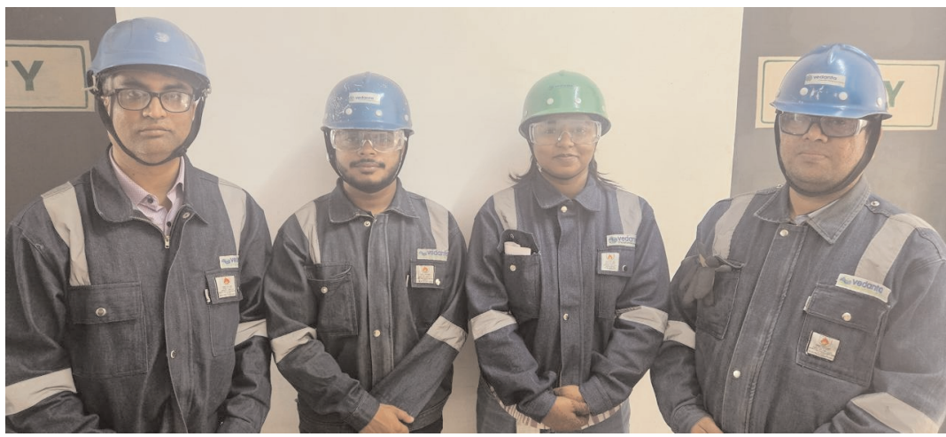
एल स्टील लिमिटेड का पर्यावरण, स्वास्थ्य एवं सुरक्षा के प्रति अटूट समर्पण के कफोकस को प्रदर्शित करता है। ये विजय उन सुरक्षा जोखिमों को सक्रिय रूप से पहचानने और कम करने के लिए ए आई - सक्षम उन्नत कैमरा पहचान की शक्ति का उपयोग करने पर ध्यान केंद्रित करने के लिए एक सुरक्षित कार्य वातावरण को बढ़ावा दिया। सावधानीपूर्वक योजना,