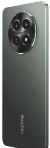
सी सीरीज में अत्याधुनिक स्मार्टफोन, रियलमी सी65 5जी लॉन्च कर रहे हैं। मीडियाटेक डायमैंसिटी 6300 5जी चिपसेट के साथ दुनिया के पहले स्मार्टफोन के रूप में रियलमी सी65 5जी अपनी बेहतर परफॉर्मंस और आधुनिक फीचर्स

मुंबई, एजेंसी। सबसे भरोसेमंद सेव प्रदाता, रियलमी ने आज अपनी चैंपियन सीरीज रियलमी सी सीरीज में रियलमी सी65 5जी लॉन्च किया इस नए स्मार्टफोन में कई इन्ोवेटिव फीचर्स के साथ शानदार डिजाइन है जो यूजर्स को स्मार्टफोन का बेहतर अनुभव प्रदान करेगा। रियलमी सी सीरीज अपनी आधुनिक फास्ट चार्जिंग, कैमरा टेक्नोलॉजी, और डिजाइन के लिए उद्योग में कई मानक स्थापित कर चुकी है। सी सीरीज का हर नया स्मार्टफोन चार महत्वपूर्ण क्षेत्रों: चार्जिंग, कैमरा, स्टोरेज, और डिजाइन में बेहतरीन और आकर्षक अपडेट्स के साथ सेगमेंट का नेतृत्व कर रहा है। इस लॉन्च के बारे में रियलमी की प्रवक्ता ने कहा रियलमी में हम हर व्यक्ति को टेक्नोलॉजी की ताकत देना चाहते हैं आज इन्ोवेशन के हमारे इस सफर का एक महत्वपूर्ण क्षण है जब हम अपनी लोकप्रिय