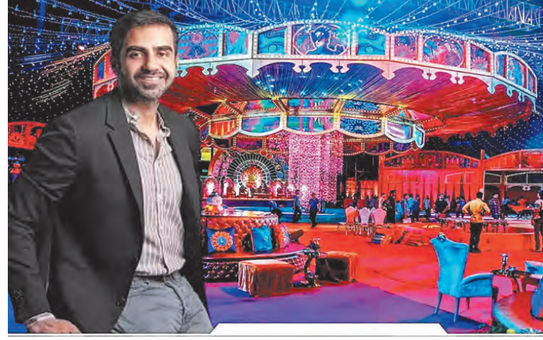
में चिंता जाहिर करने वाली जानकारी दी है। उन्होंने कुछ डरावने लेकिन सच्चे तथ्यों को उजागर करने के लिए विस्तृत इन्फोग्राफ का इस्तेमाल किया है। रिपोर्ट के अनुसार, भारत में नवंबर-दिसंबर 2023 के बीच 35 लाख शादियां हुईं। दूसरे शब्दों में हर सेकेंड लगभग

नई दिल्ली, एजेंसी। निखिल कामथ देश के जाने-माने उद्यमी और निवेशक हैं। वह सबसे बड़ी रिटेल स्टॉकब्रोकर जेरोधा के संस्थापक हैं। लगनों के इस मौसम में उन्होंने शादी-ब्याह पर होने वाले खर्चों पर कुछ गंभीर इन्पुट शेयर किए हैं। ये दिखाते हैं कि कैसे भारतीय शादी पर अपनी गाढ़ी कमाई को लुटा रहे हैं। इंडियन वेडिंग मार्केट 50 अरब डॉलर की है। यह 30 फीसदी की सालाना दर से बढ़ रही है। इस बढ़ोतरी के कारण भारत अमेरिका से आगे निकल दुनिया का सबसे बड़ा वेडिंग मार्केट बन सकता है। भारतीय महंगी शादियों के लिए मशहूर हैं। विवाह को सामाजिक प्रतिष्ठा से जोड़कर देखा जाता है। बदलती आकांक्षाओं और तकनीकी प्रगति के कारण भारत में शादियां में बड़ा बदलाव आया है। जेरोधा के सह-संस्थापक निखिल कामथ ने भारतीय शादियों की वास्तविक लागत के बारे में चिंता जाहिर करने वाली जानकारी दी है। उन्होंने कुछ डरावने लेकिन सच्चे तथ्यों को उजागर करने के लिए विस्तृत इन्फोग्राफ का इस्तेमाल किया है। रिपोर्ट के अनुसार, भारत में नवंबर-दिसंबर 2023 के बीच 35 लाख शादियां हुईं। दूसरे शब्दों में हर सेकेंड लगभग