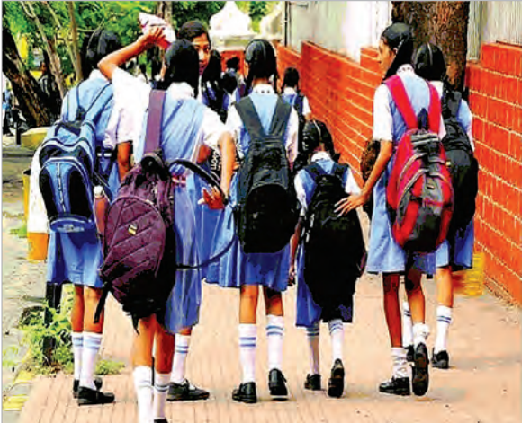
कक्षा नौ एवं इससे ऊपर की कक्षाएं सात बजे से 12:00

स्वदेश संवाददाता रांची: राज्य में भीषण गर्मी को देखते स्कूलों में कक्षाओं का समय सरकार ने निर्धारित कर दिया है। इस संबंध में शनिवार को स्कूली शिक्षा एवं साक्षरता विभाग ने जारी आदेश में कहा है कि सभी कोटि के सरकारी, गैर-सरकारी, सहायता प्राप्त-गैर सहायता प्राप्त (अल्पसंख्यक सहित) एवं सभी निजी स्कूलों में केजी से लेकर आठवीं तक की कक्षाएं सुबह सात बजे से 11:30 बजे तक ही चलेंगी।