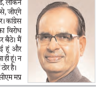
नितिन गडकरी ने कहा-यदि किसी को लगता है मैंने कोई भेदभाव किया है तो वोट मत देना

राहुल तो चले गए वानवाड, लेकिन हमने कहा- लड़ेंगे तो यहीं से, जीएंगे तो यहीं पर, मरेंगे तो यहीं पर। कांग्रेस का विसर्जन तय है। ये मोदी का विरोध करते-करते श्रीराम का विरोध कर बैठे। मैं नेता नहीं हूँ। मैं तो आपका भाई हूँ और बच्चों का मामा हूँ। मैं आपके जैसा ही हूँ। न तुमको कोई और है न हमको कोई ठोकर है।