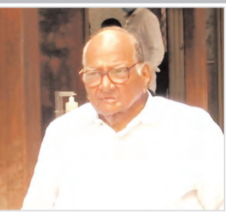
शरद पवार, एनसीपी नेता

हम विधानसभा में ज्यादा जगह पर लड़ने की कोशिश करेंगे। मैं 10 साल से सत्ता में नहीं हूँ। अमित शाह बताएं 10 साल तक आप सत्ता में थे क्या किया। फंडाबोस ने धन्यार समाज को आरक्षण देने की बात कही थी। शरद पवार, एनसीपी नेता